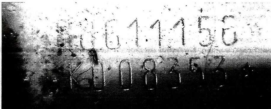
Imagem 07 – Chassi.

Do chassi/do VIN: Examinando o local onde comumente é gravada a numeração identificadora do veículo, com auxílio de reagentes químicos específicos, o Perito constatou tratar-se de numeração ESPÚRIA, ou seja, PRODUTO DE ADULTERAÇÃO. Não foi possível identificar a numeração original;