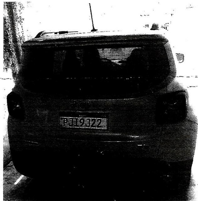
Imagem 05 – Traseira.

Da placa: A placa do veículo estava desconforme com as normas, não possuía todas as características da placa padrão Mercosul.