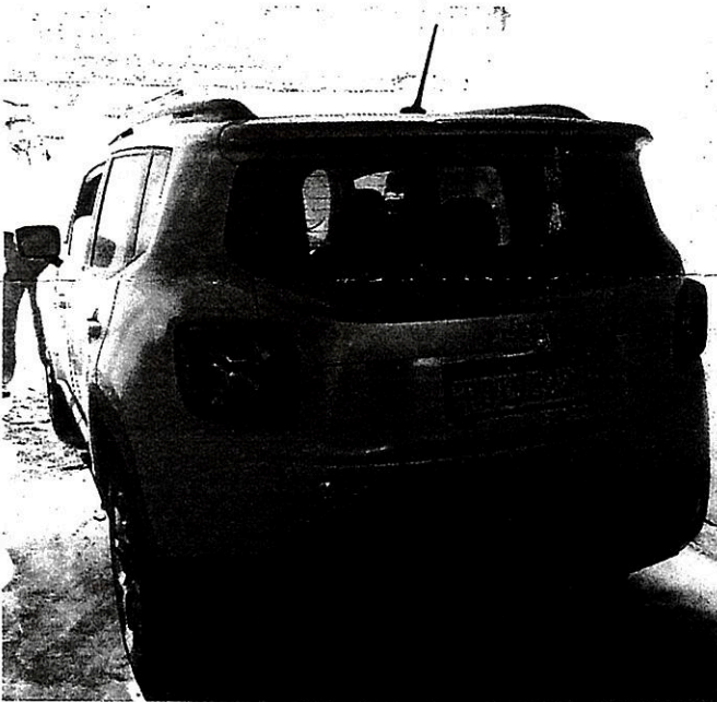
Imagem 04 – Lateral esquerda.