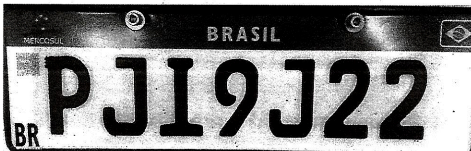
Imagem 06 – Placa do veículo fora do padrão oficial.

Da placa: A placa do veículo estava desconforme com as normas, não possuía todas as características da placa padrão Mercosul.