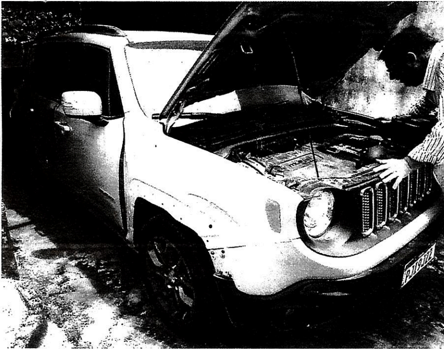
Imagem 02 – Lateral direita.