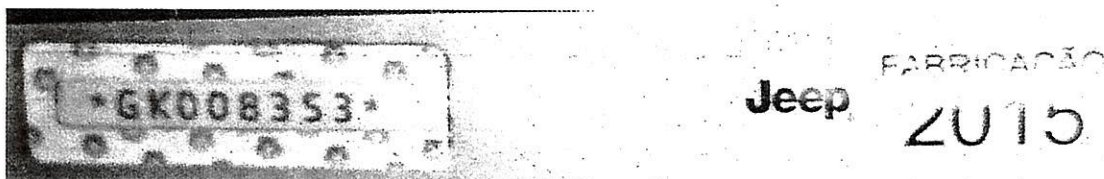
Imagem 09 – Etiquetas.

Das Etiquetas: Apresentavam numeração coincidente com a gravação espúria;