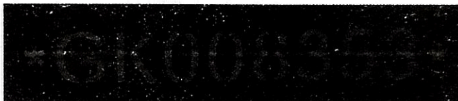
Imagem 08 – Número do vidro.

Dos Vidros: Apresentavam numeração coincidente com a gravação espúria;