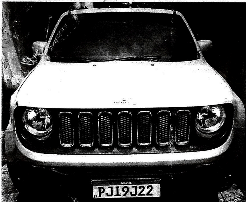
Imagem 01 – Veículo periciado.

Das características do Veículo (conforme se apresentava): Marca: JEEP; Tipo: utilitário; Modelo: RENEGADE LNGTD AT D; Cor atual: PRATA; Portando Placas de Identificação: PJI9J22 SANTO ANTONIO DE JESUS-BA Espécie: MISTO; Ano de Fabricação: 2015; Número de Identificação do Veículo (VIN): 988611156GK008353; Série confirmativa do VIN impressa em etiquetas: ausente; Série do Motor gravada no bloco: 552616747294364; Série da Seção Indicadora do Veículo (VIS) impressa na etiqueta autocolante: *GK008353*; Séries VIS gravadas nos vidros: *GK008353*; Informação de Roubo/Furto: Sem restrição (consulta Sinesp Infoseg em 10/10/2020 às 10 horas e 30 minutos).