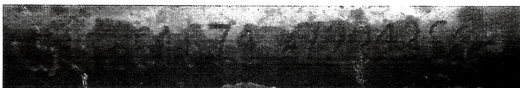
Imagem 10 – Número do motor.

Do motor: Examinando o local onde comumente é gravada a numeração identificadora do motor, foi encontrada a numeração espúria, com sinais de adulteração. Não foi possível identificar o número original;