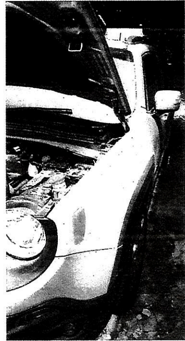
Imagem 03 – Lateral esquerda.