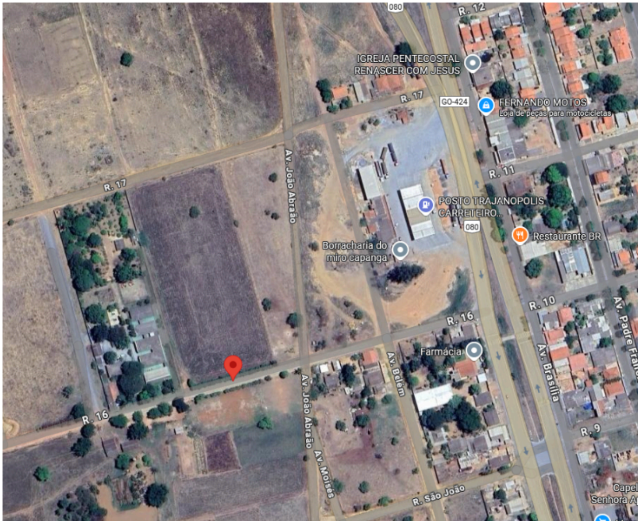
Imagem 02. Localização da Quadra 11 - Google Maps.