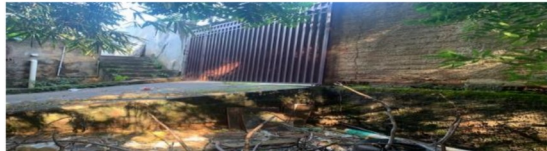
PORTÃO LOTE 16.DIVISA COM O LOTE 15

FOTOS DATA DE 22/03/2025. PROC 0011718-46.2020.5.18.0008 MANDADO ID 28ace4a