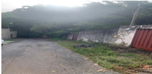
FOTO DA FACHADA. DATA DE 31/03/2025