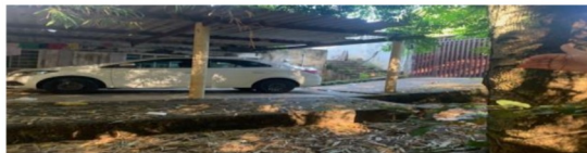
GARAGEM LOTE 16