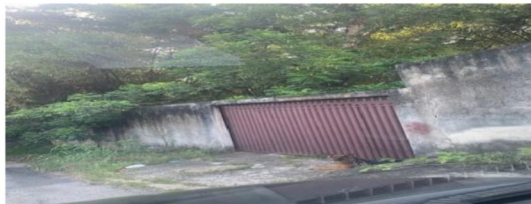
FOTO DA FACHADA. DATA DE 01/04/2025