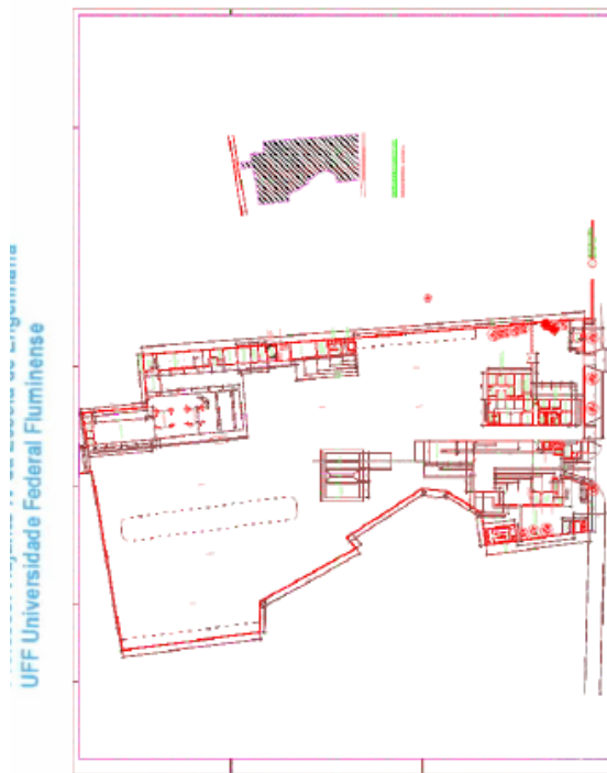
Plantas constantes do laudo