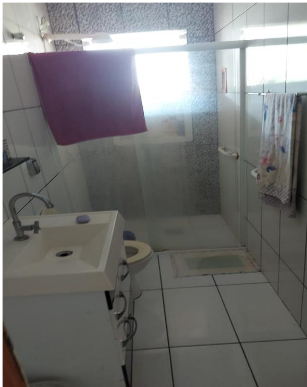
Sanitário da edícula dos fundos.