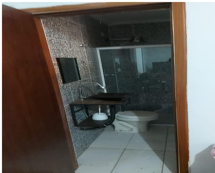
Sanitário da suíte.