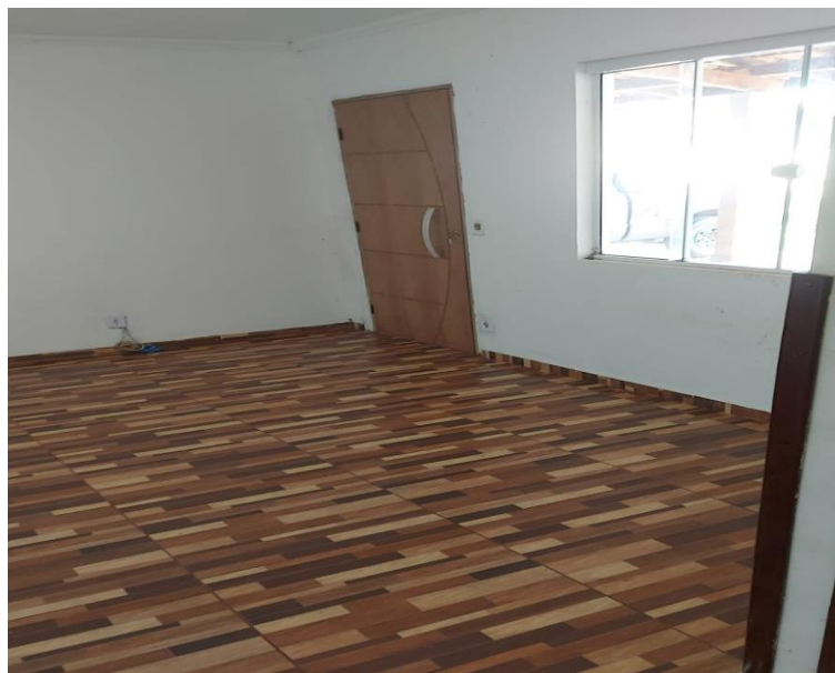
Acesso à sala de estar da segunda edícula.