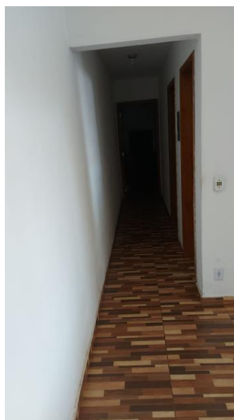
Acesso aos quartos através da sala de estar.