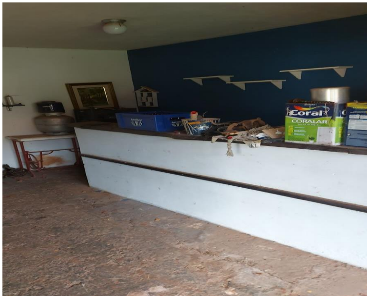
Acesso à primeira edícula. Note-se o piso em concreto desempenado