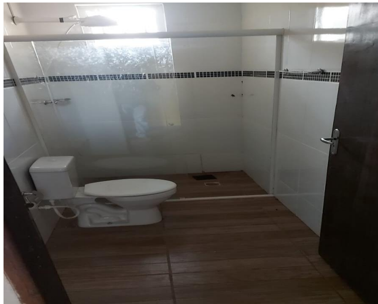
Imagem do sanitário da edícula de entrada.