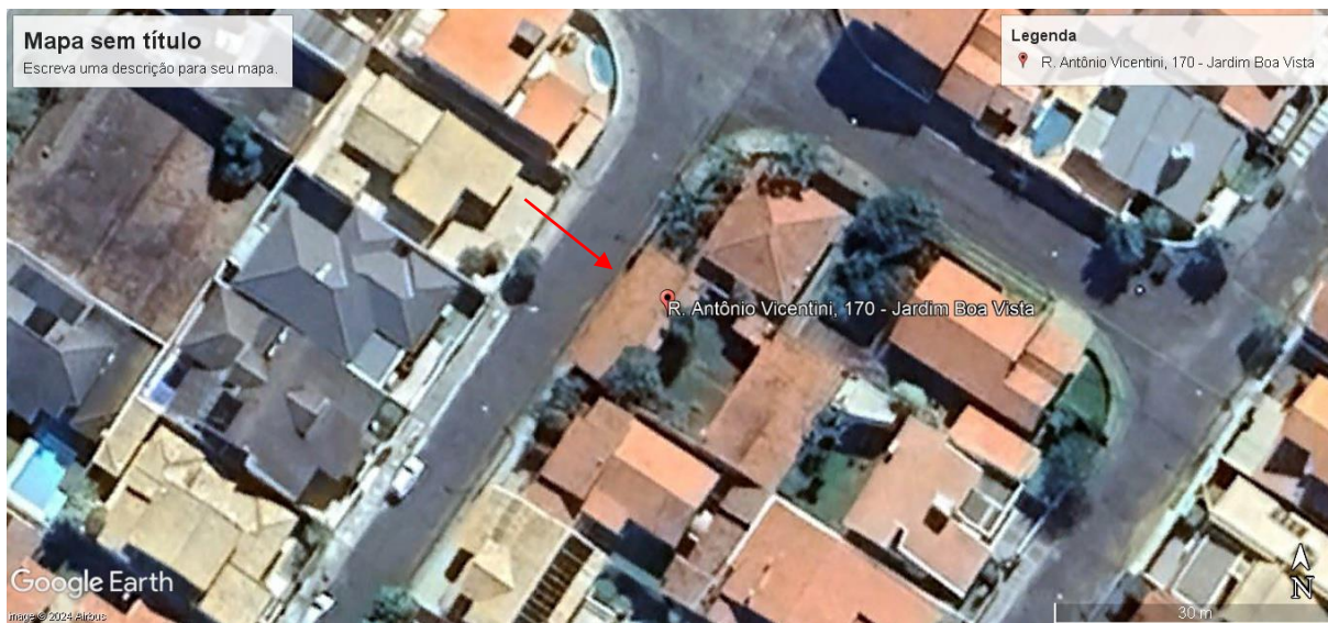
Imagem georreferenciada indicando a localização do imóvel