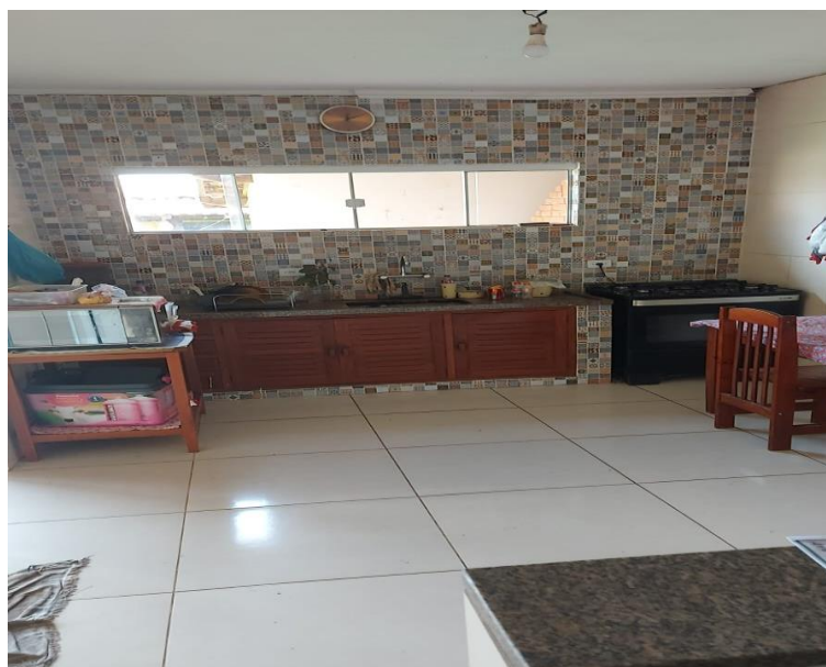
Cozinha estilo americana da edícula dos fundos.