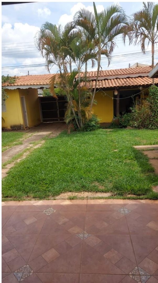
Acesso ao local