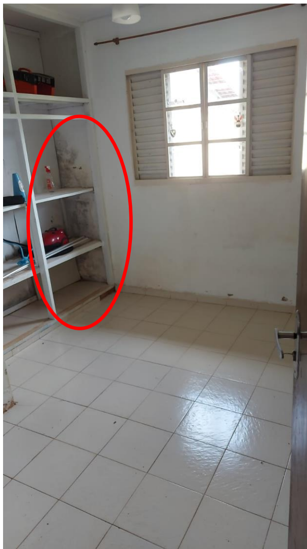
Imagem de um dos quartos da edícula dos fundos. Note a umidade ascendente no local.