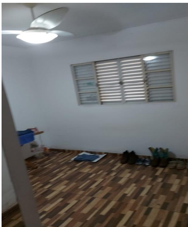
Um dos quartos da edícula dos fundos.