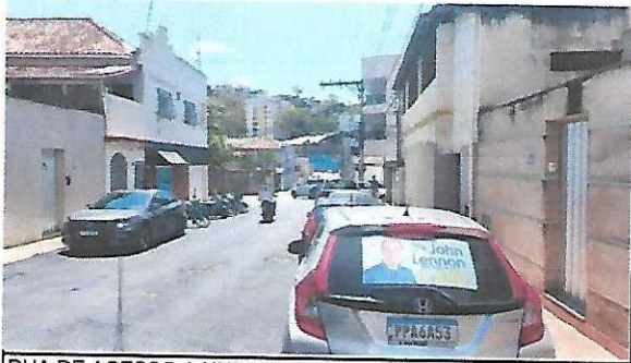
RUA DE ACESSO A UNIDADE