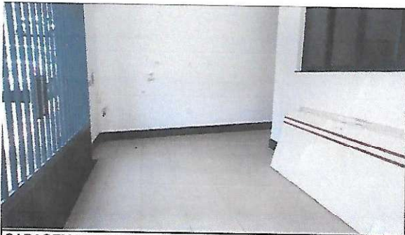
GARAGEM PARA MOTO