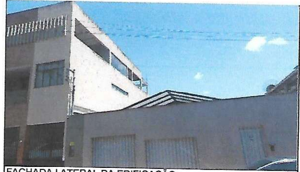
FACHADA LATERAL DA EDIFICAÇÃO