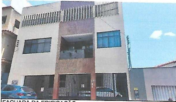
FACHADA DA EDIFICAÇÃO