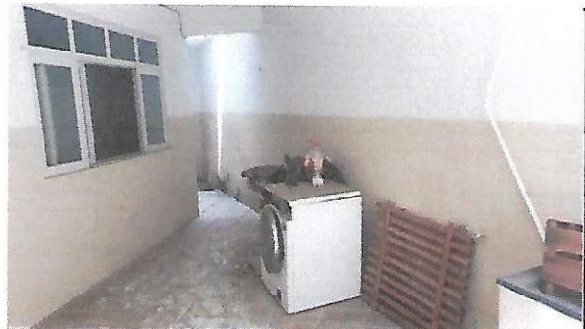
ÁREA DE SERVIÇO