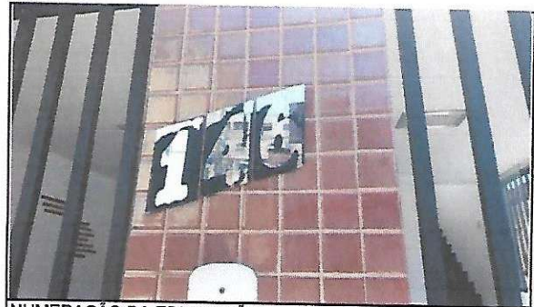
NUMERAÇÃO DA EDIFICAÇÃO