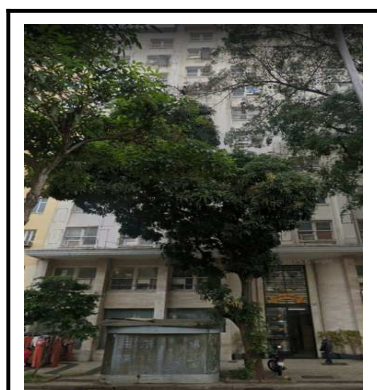
FOTO DA FACHADA DO PRÉDIO

Endereço: Av. Franklin Roosevelt, 115, Centro, Rio de Janeiro-RJ.