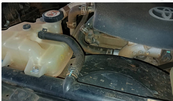
Gravação do Câmbio

✓ - 066.1 Gravação identificadora obstruída/sem acesso