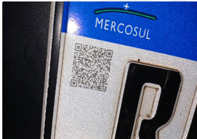
Lacre /QR code