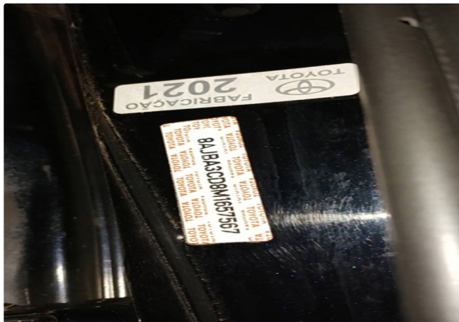
Eta/VIS do batente da porta