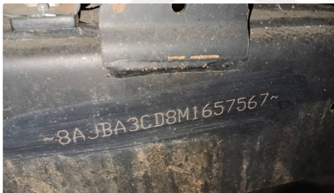
Gravação do Chassi

✓ 018 - Gravação identificadora sem vestígios aparentes de adulteração.