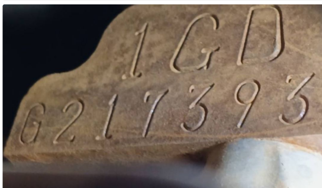
Gravação do Motor

✓ 018 - Gravação identificadora sem vestígios aparentes de adulteração.