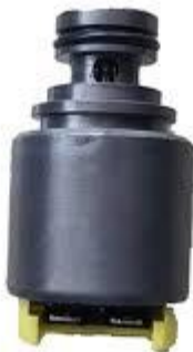
SOLENOIDE DE ENGATE