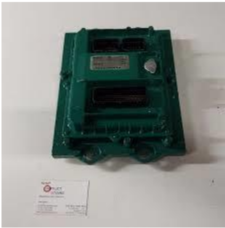
MODULO UNIDADE DE CONTROLE