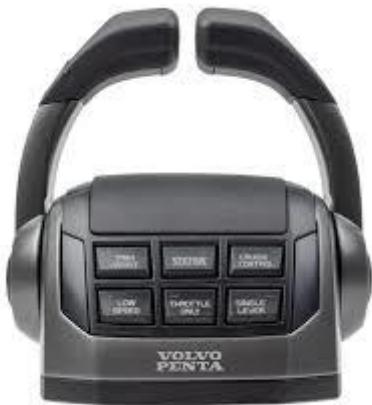
COMANDOS ELETRÔNICO DUPLO EVC E