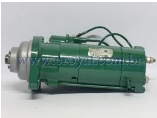
MOTOR DE PARTIDA