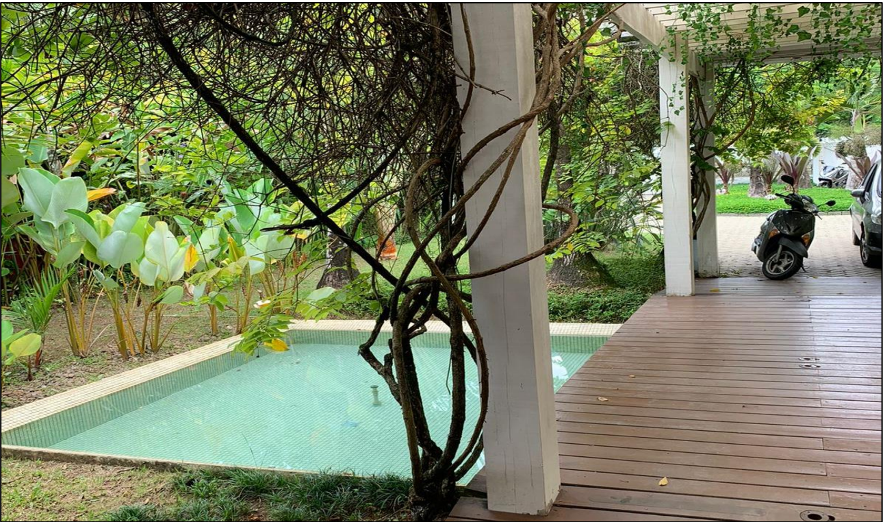
IMAGEM 03: Vista lateral direita interna ao imóvel