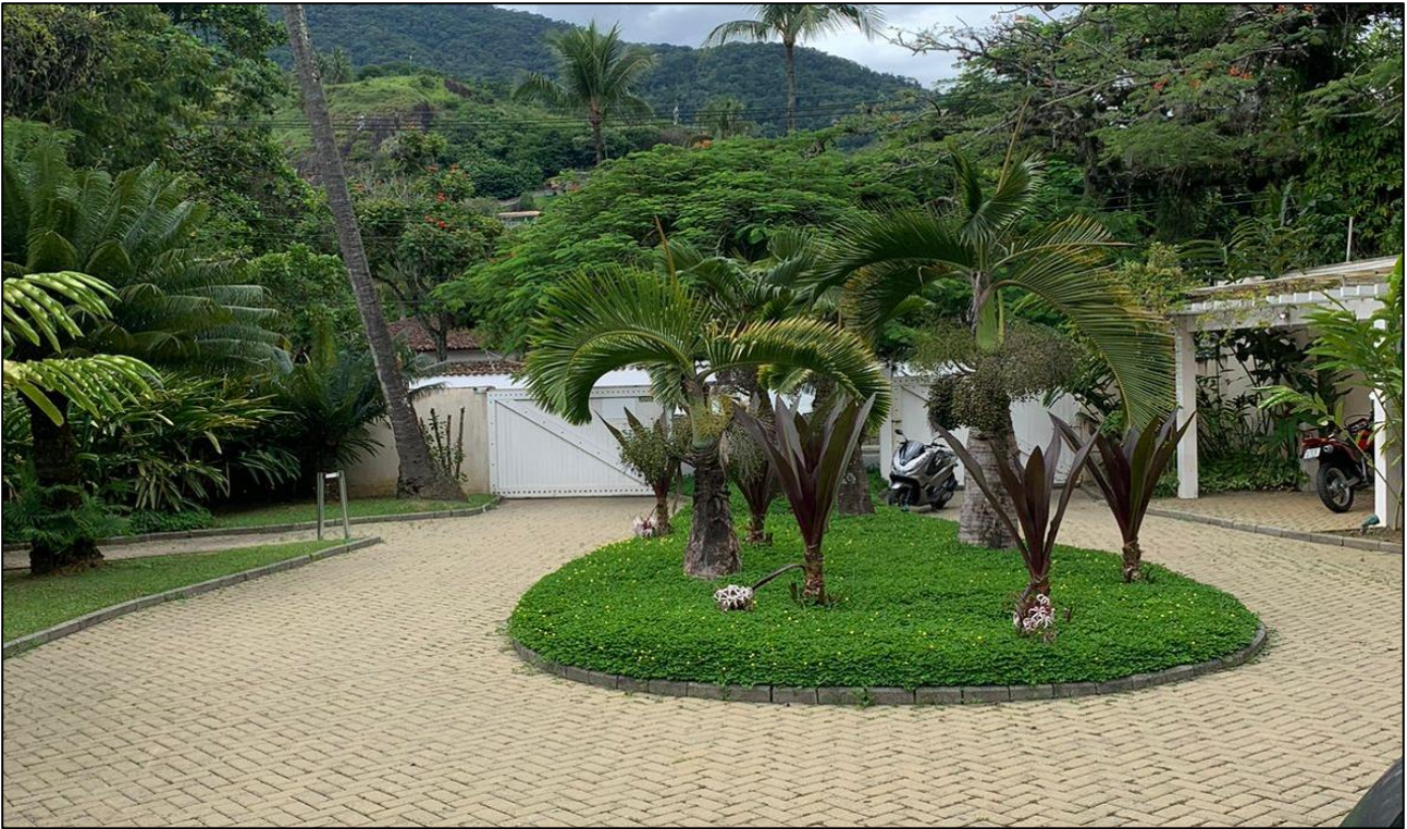
IMAGEM 02: Vista frontal interna ao imóvel