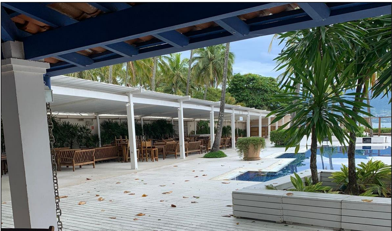
IMAGEM 05: Vista lateral esquerda interna e área de lazer