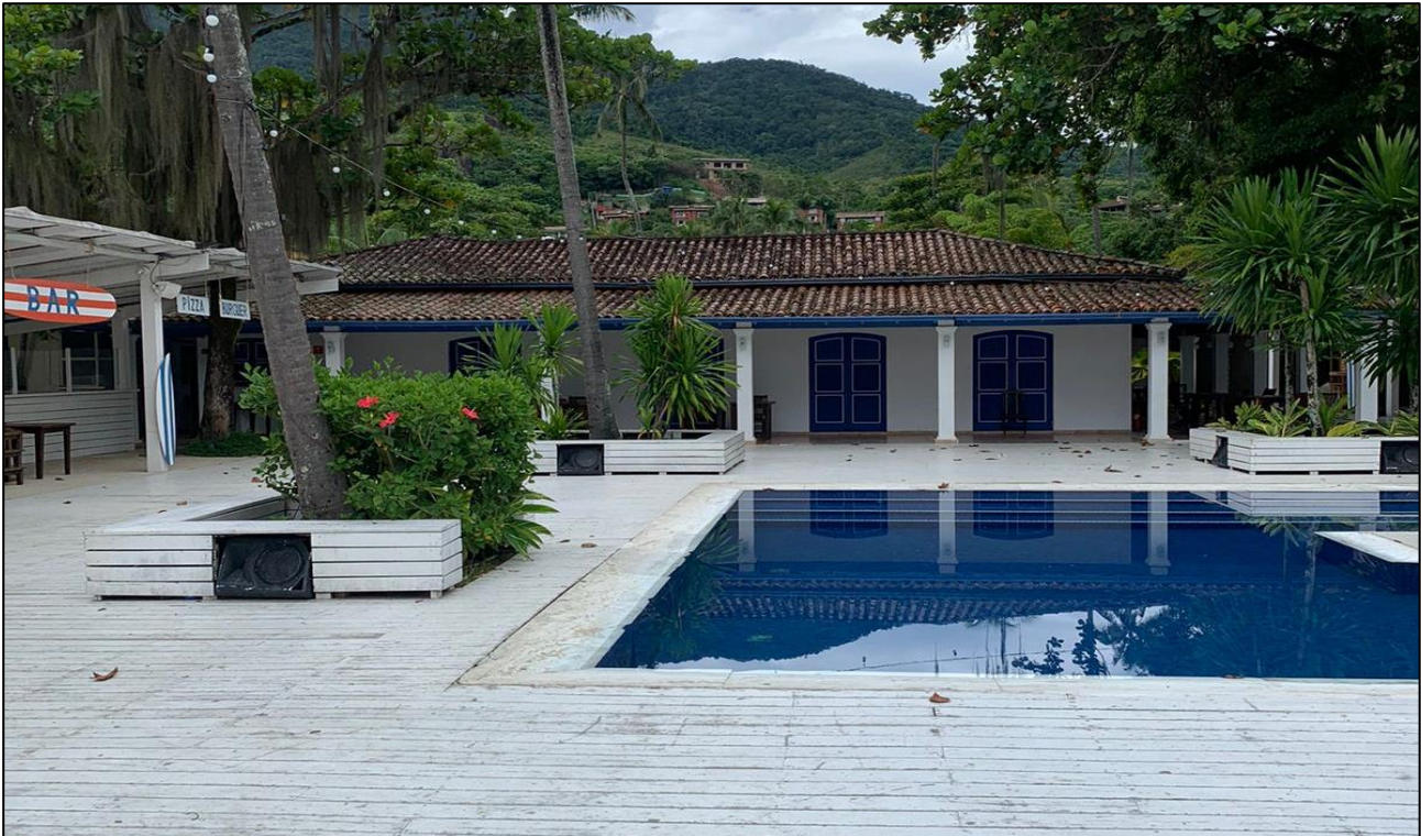
IMAGEM 06: Vista lateral frontal da piscina e salão