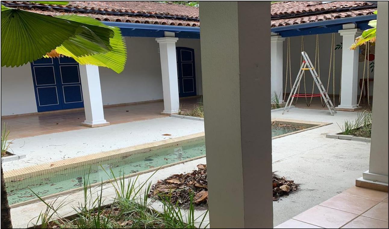
IMAGEM 04: Vista lateral esquerda interna ao imóvel