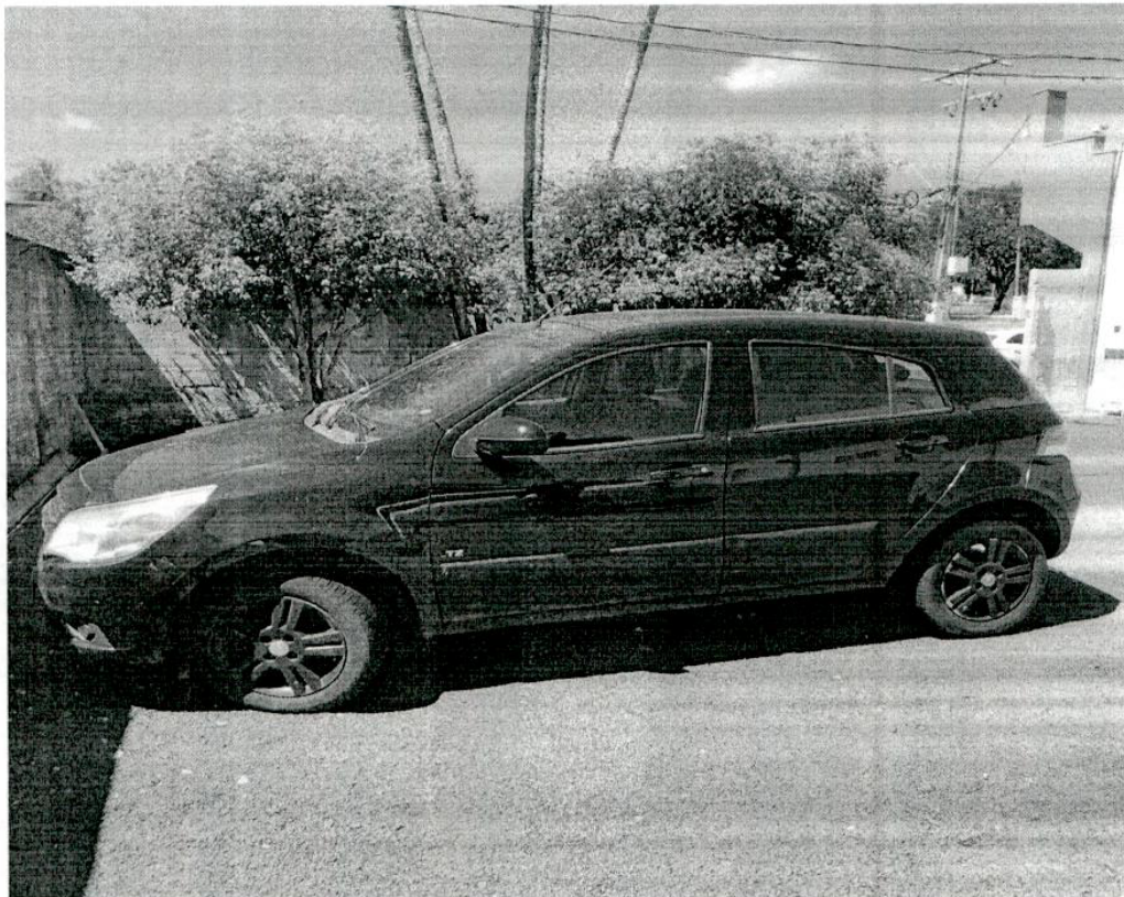
FOTO DO BEM PENHORADO