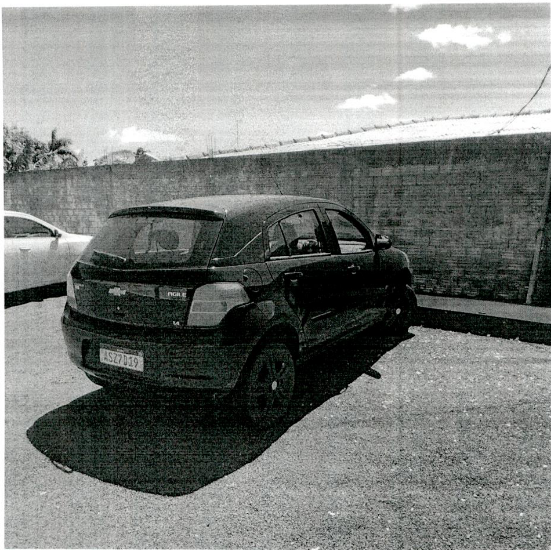
FOTO DO BEM PENHORADO