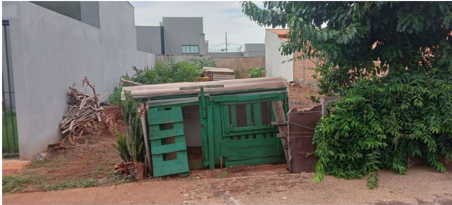
Lote sem benfeitorias, topografia plana.