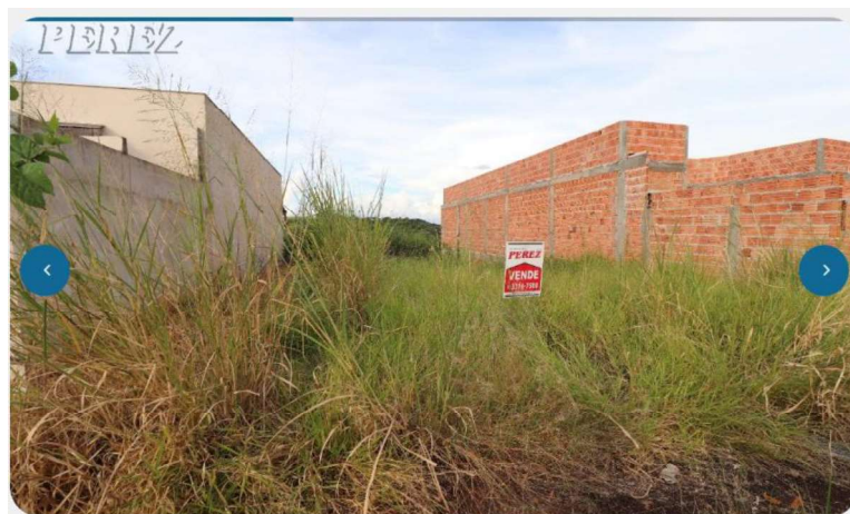
Terrenos à venda no Jardim Tenerife - Londrina/PR R$ 120.000 Cód. do imóvel: 7826

Terreno sem benfeitorias com 250m², localizado no Jardim Tenerife, sendo 10m² de frente e 25m² de fundo com leve caimento.