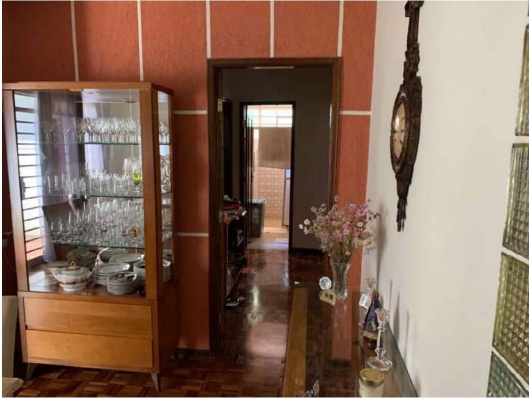
2º OFÍCIO DE AVALIADOR JUDICIAL