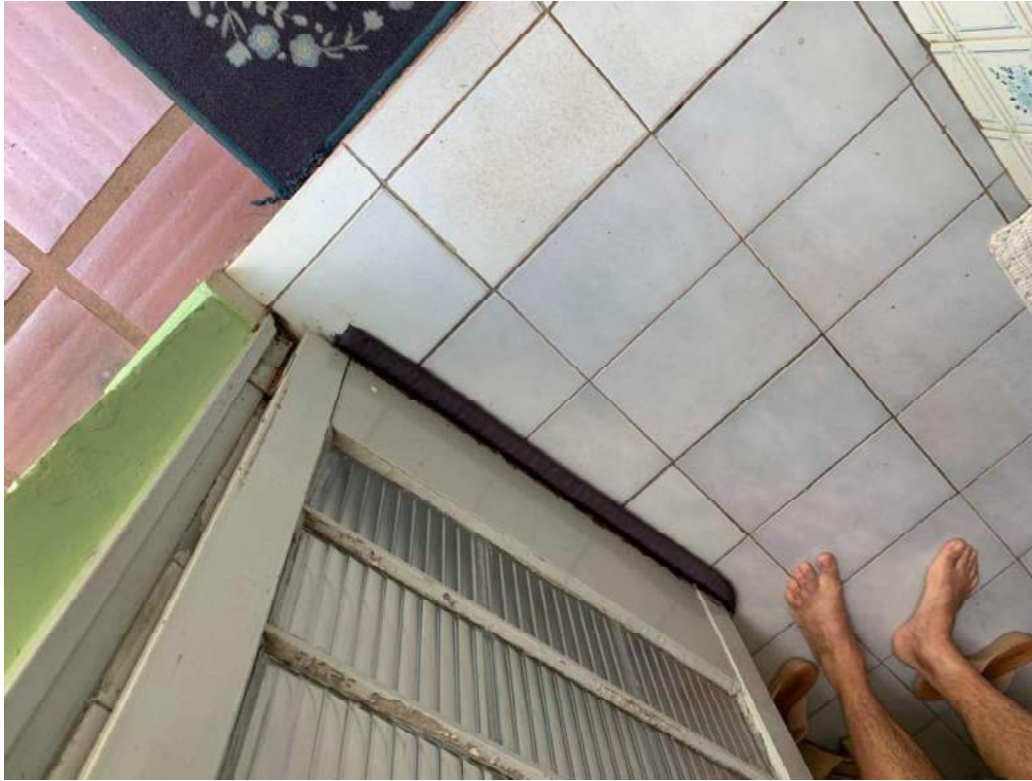
2º OFÍCIO DE AVALIADOR JUDICIAL