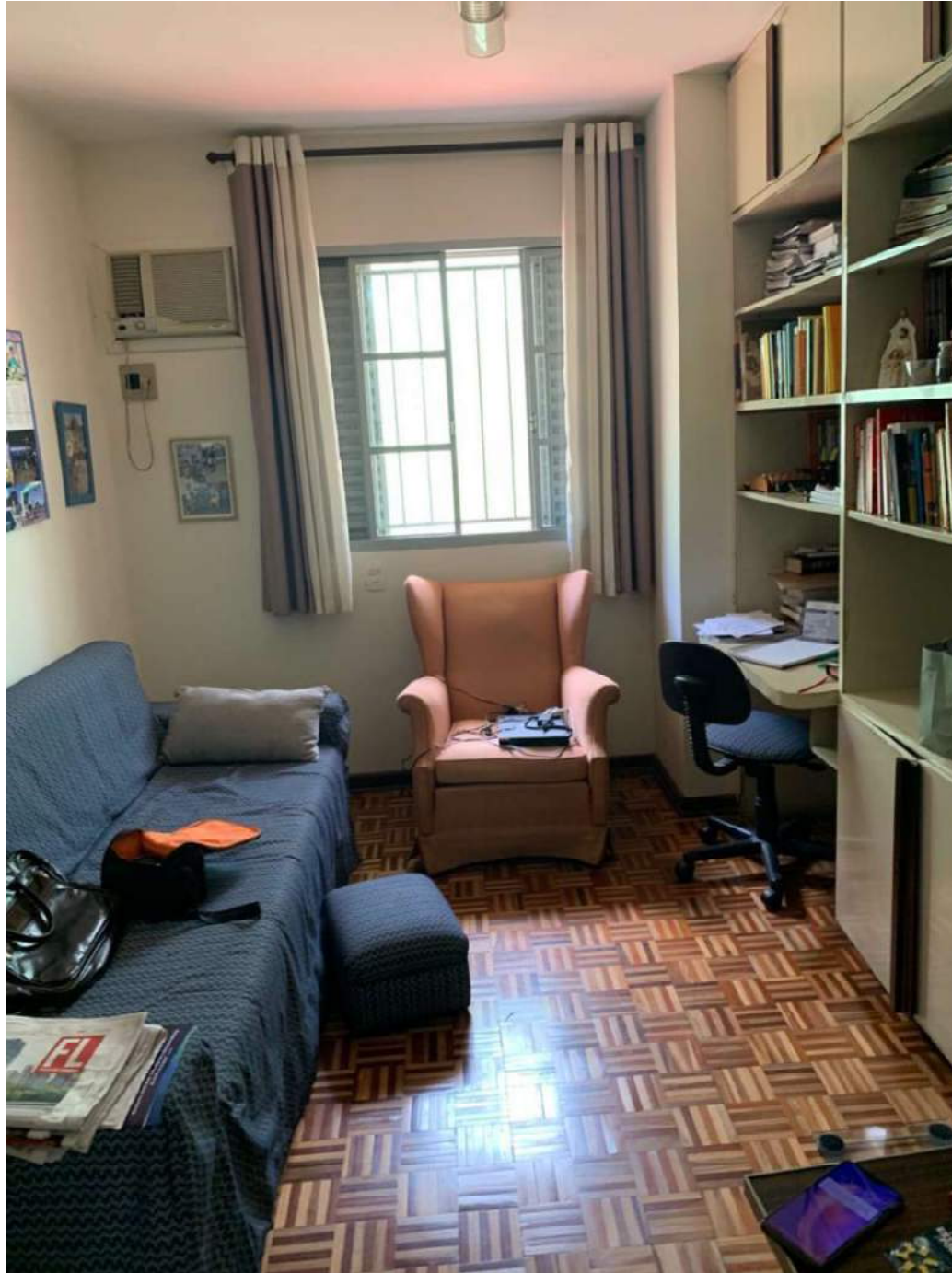
2º OFÍCIO DE AVALIADOR JUDICIAL