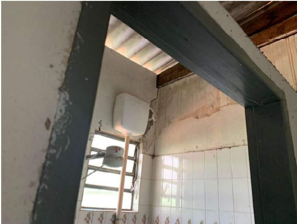
2º OFÍCIO DE AVALIADOR JUDICIAL