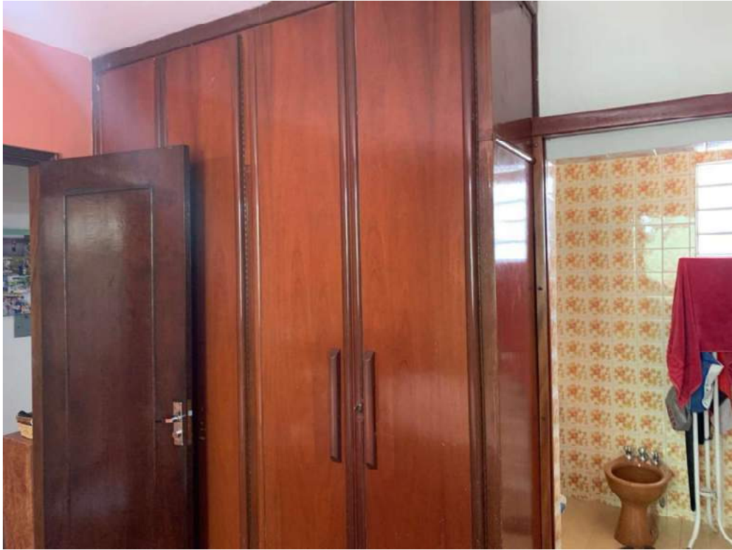
2º OFÍCIO DE AVALIADOR JUDICIAL