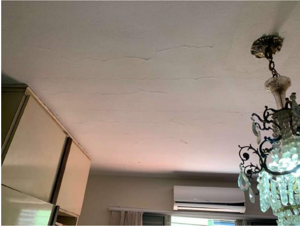
2º OFÍCIO DE AVALIADOR JUDICIAL