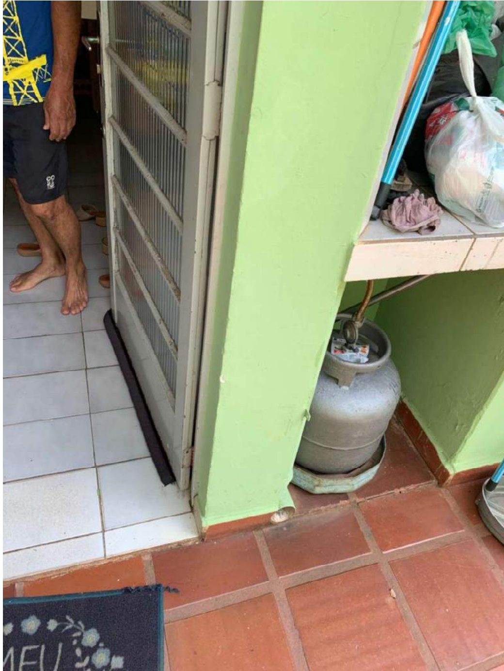
2º OFÍCIO DE AVALIADOR JUDICIAL