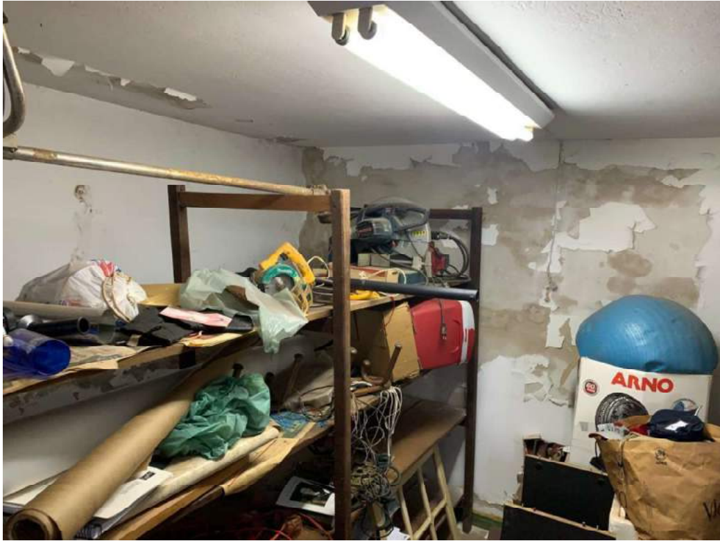
2º OFÍCIO DE AVALIADOR JUDICIAL