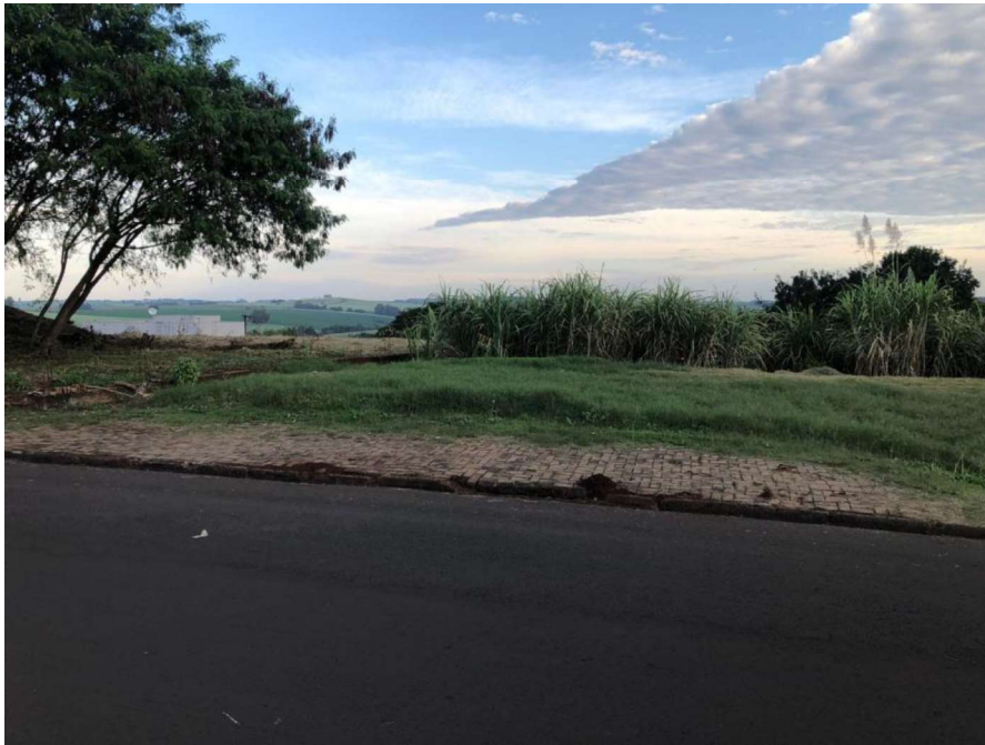
Localizada Av. Presidente Tancredo Neves, S/N.

4) Data de terras sob n° 09, Matrícula 17.660, CRI Ivaiporã