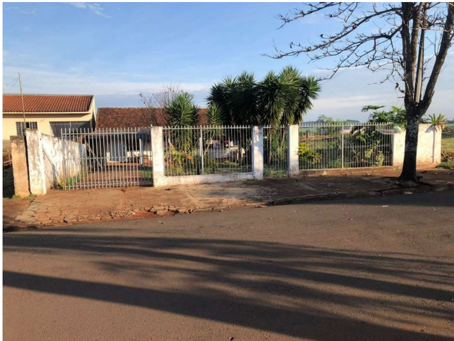
Localizado Av. Presidente Tancredo Neves, n° 3575, Ivaiporã-PR

5) Data de terras sob n° 13, da quadra n° 149, Casa fundos, Matrícula n° 14.919, CRI Ivaiporã