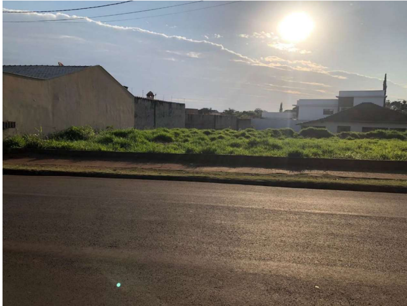
Localizada em Rua Pitanga – Ivaiporã – PR.