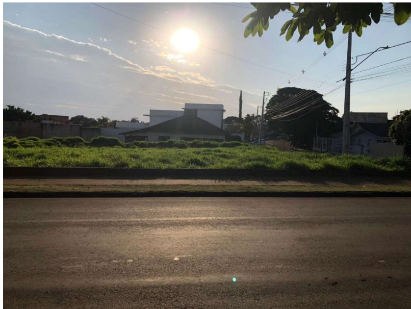
Localizado na Rua Pitanga – Ivaiporã – PR