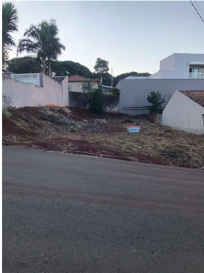
Localizado na Rua Diva Proença, Ivaiporã

Os bens constantes do Mandado que não foram fotografados (2 e 7), não foram localizados com precisão pela Prefeitura Municipal, por ausência de informações precisas quanto ao desmembramento das chácaras em zonas rurais. Assim, ante a ausência de informações, não foram avaliados.