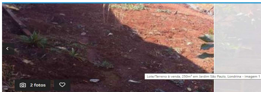
Lote/Terreno à venda, 250m 2 em Jardim São Paulo, Londrina - imagem 1

https://www.vivareal.com.br/imovel/lote-terreno-jardim-sao-paulo-bairros-londrina-250m2-venda-RS110000-id-2571733746/