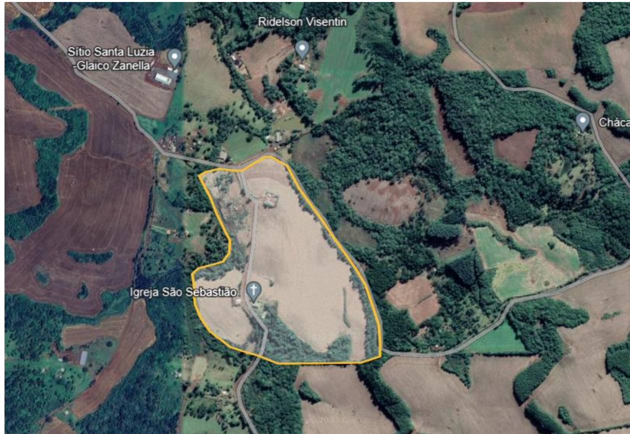
Figura 1 Área aproximada