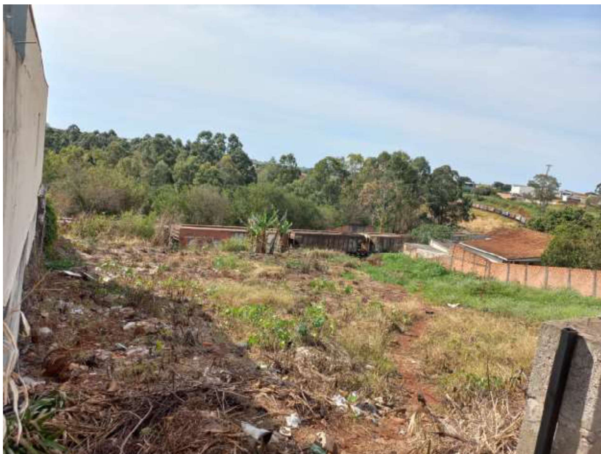
Figura 4 - Vista interna dos lotes 32 e 33 pela abertura lateral esquerda.