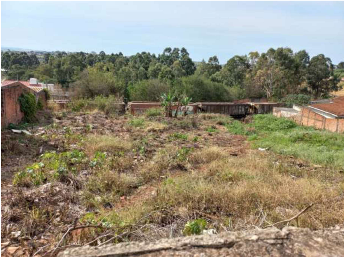
Figura 5 – Vista dos lotes 32 e 33.