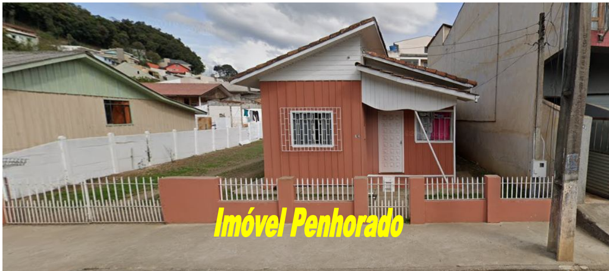
Imagem captada na data de 08.09.2022