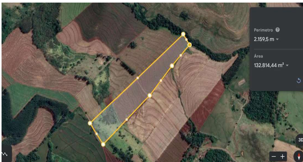
Área aproximada do lote.