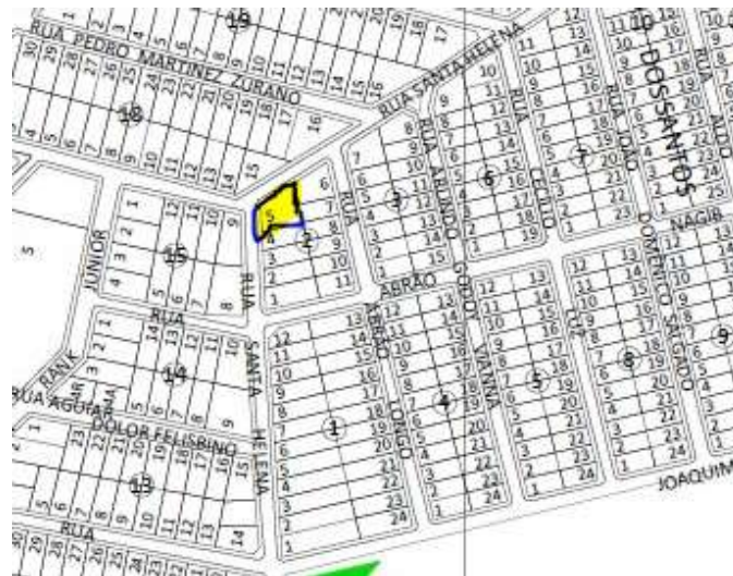
Figura 2. Mapa de Lotes de Apucarana, com demarcação do terreno.