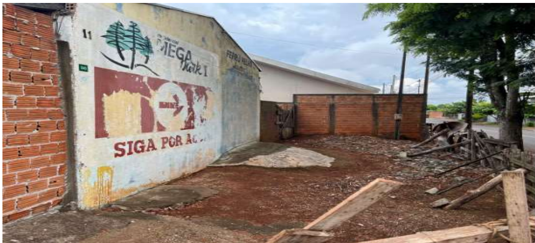
Figura 4. Lateral do imóvel.