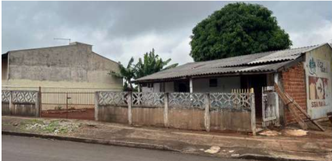
Figura 3. Frente do imóvel