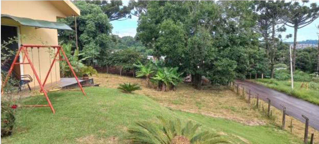
Figura 13 – divisa com a Rua do Aço e com o lote 15 ao fundo.

Autos: ATOrd 0001085-77.2016.5.09.0133 Reclamante: JOSE BONIFACIO Reclamado: SAO BORJA TRANSPORTES LTDA E OUTROS (4) Destinatário: GLOBAL ADMINISTRADORA E EMPREENDIMENTOS SS LTDA