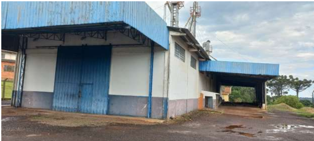
Figura 10 – barracão