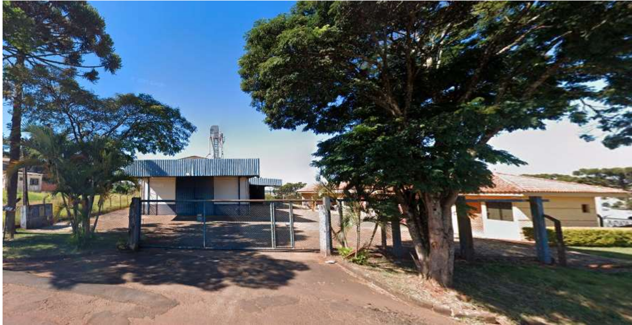
Figura 7 - Fachada do imóvel

Autos: ATOrd 0001085-77.2016.5.09.0133 Reclamante: JOSE BONIFACIO Reclamado: SAO BORJA TRANSPORTES LTDA E OUTROS (4) Destinatário: GLOBAL ADMINISTRADORA E EMPREENDIMENTOS SS LTDA