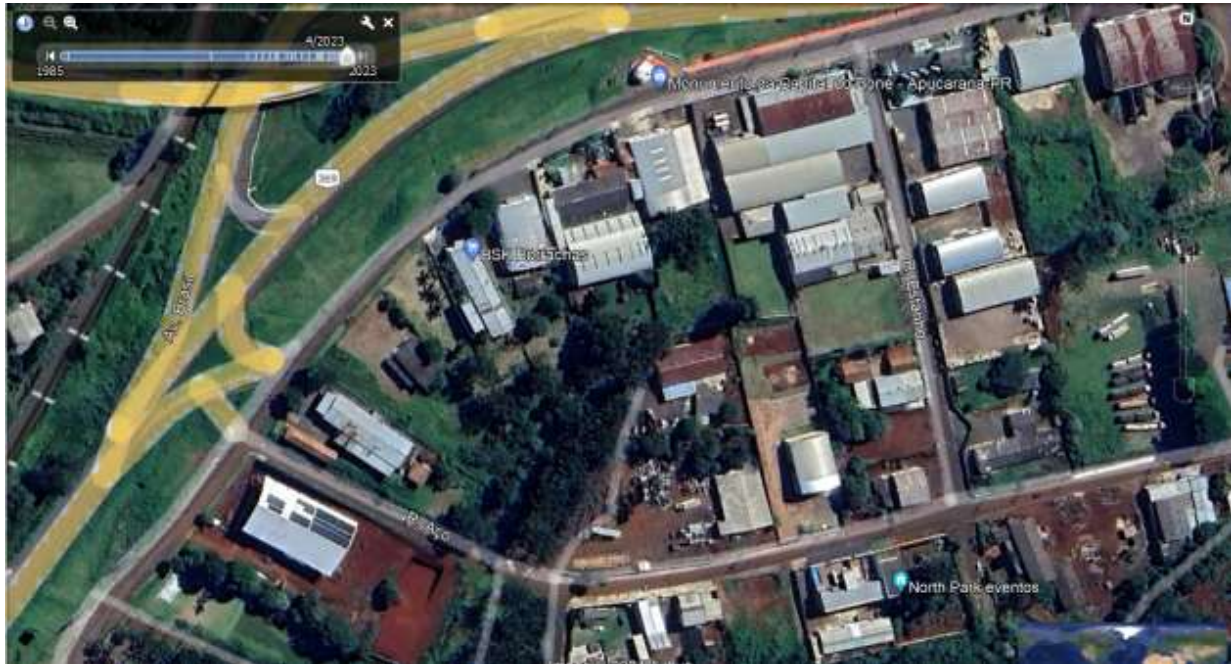
Figura 1 - Vista aérea.