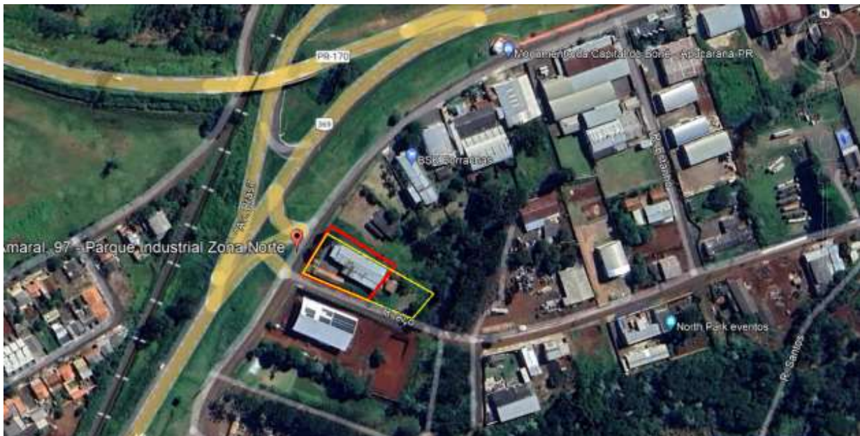
Figura 6 - Sobreposição do Lote 1, constante da matrícula 20.155 em vermelho e o atual 1/16 rem em amarelo, da divisão atual.