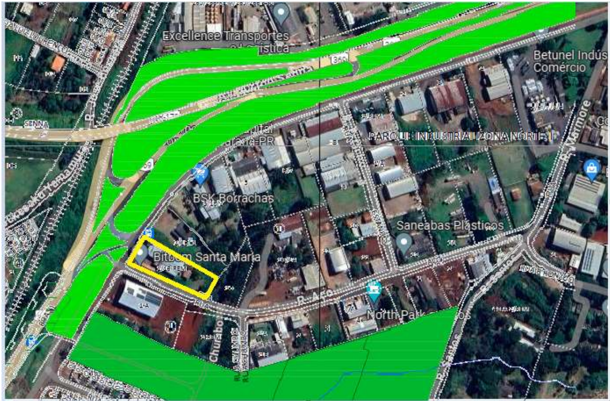
Figura 3 – Figura 1 e 2 sobrepostas com marcação do lote.

Autos: ATOrd 0001085-77.2016.5.09.0133 Reclamante: JOSE BONIFACIO Reclamado: SAO BORJA TRANSPORTES LTDA E OUTROS (4) Destinatário: GLOBAL ADMINISTRADORA E EMPREENDIMENTOS SS LTDA