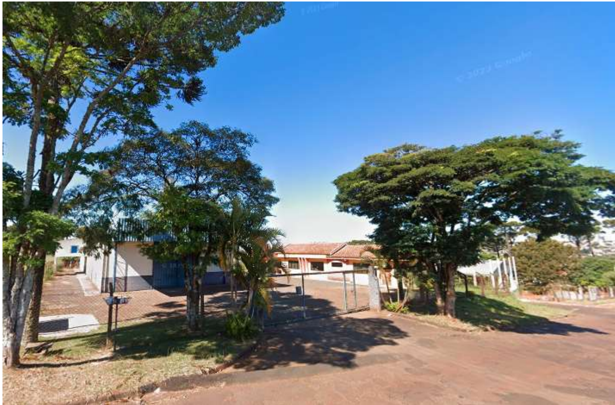
Figura 9 - galpão e escritório

Autos: ATOrd 0001085-77.2016.5.09.0133 Reclamante: JOSE BONIFACIO Reclamado: SAO BORJA TRANSPORTES LTDA E OUTROS (4) Destinatário: GLOBAL ADMINISTRADORA E EMPREENDIMENTOS SS LTDA