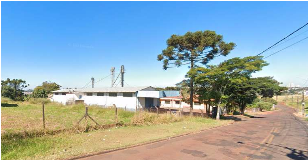
Figura 8 - Lateral do galpão e frente do escritório