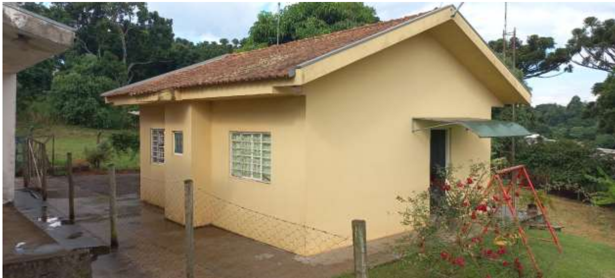
Figura 12 - casa dos fundos