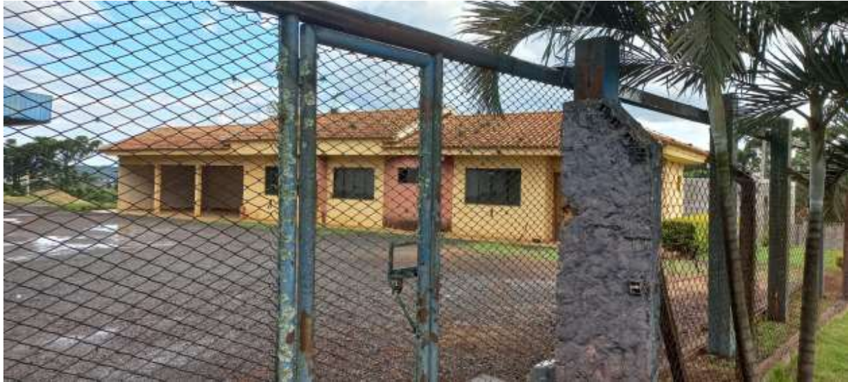
Figura 11 – frente escritório