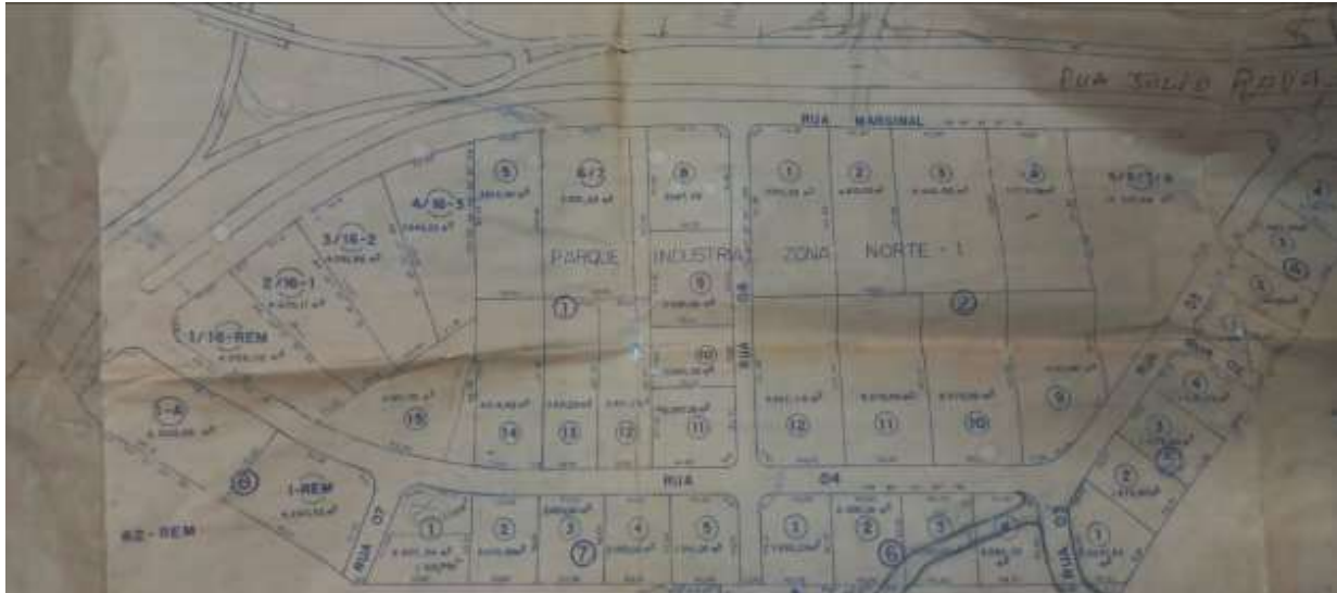
Figura 5– Lote 1/16 –Rem, efetivamente penhorado. Área total de 4.055,02m 2 . Planta atual do Parque Industrial Zona Norte obtida na Prefeitura.

Autos: ATOrd 0001085-77.2016.5.09.0133 Reclamante: JOSE BONIFACIO Reclamado: SAO BORJA TRANSPORTES LTDA E OUTROS (4) Destinatário: GLOBAL ADMINISTRADORA E EMPREENDIMENTOS SS LTDA