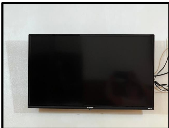
TV SEMP (ROKU TV) 32' com controle.