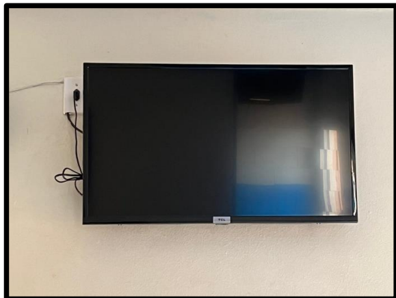
TV TCL 32' com controle