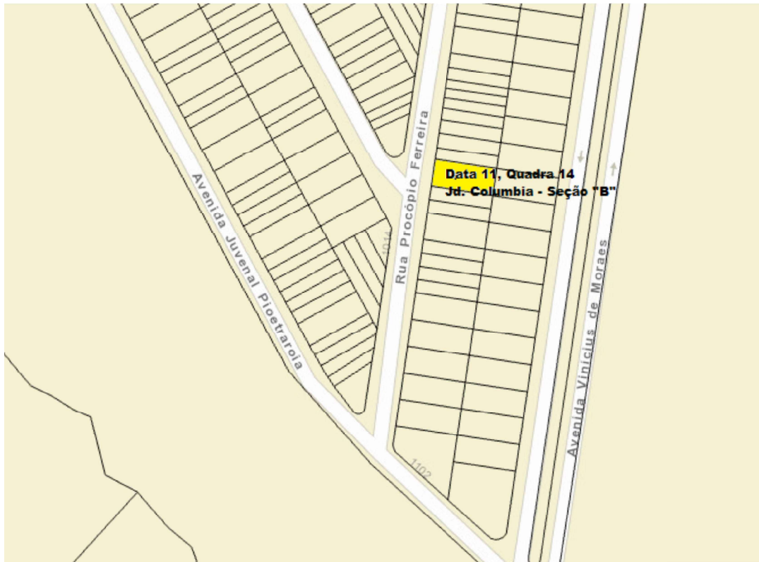
Imagem: Zoneamento Facil Londrina