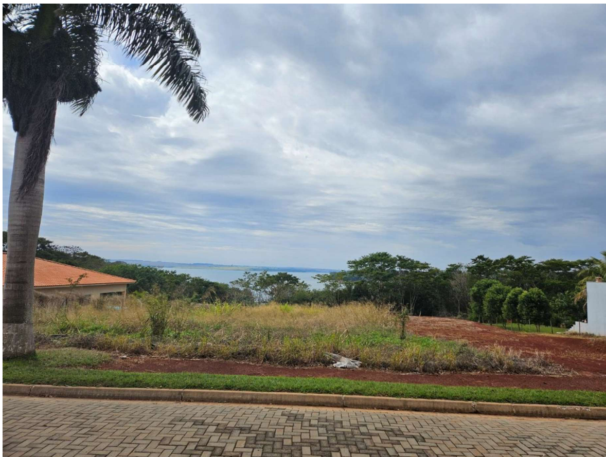
Vista frontal do imóvel, com parcela correspondente à área de preservação ao fundo