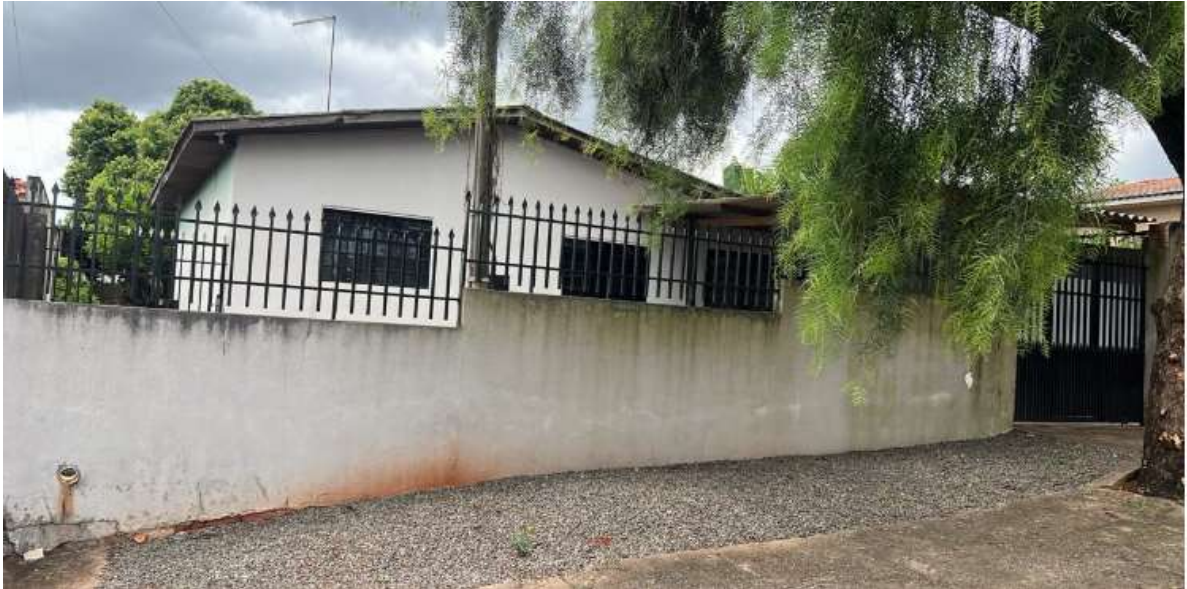
Fotografia atual do imóvel, tirada no local da diligência.

Local da diligência: RUA CARLOS DE CARVALHO, 567, LOTE 25, JARDIM PONTA GROSSA, APUCARANA/PR