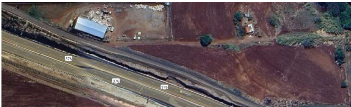
Imóvel visto de cima pelo Google Maps

Parte ideal correspondente à 50% (cinquenta por cento) do imóvel de matrícula nº14.495, registrado junto ao 2º Serviço de Registro de Imóveis da Comarca de Jandaia do Sul/PR.