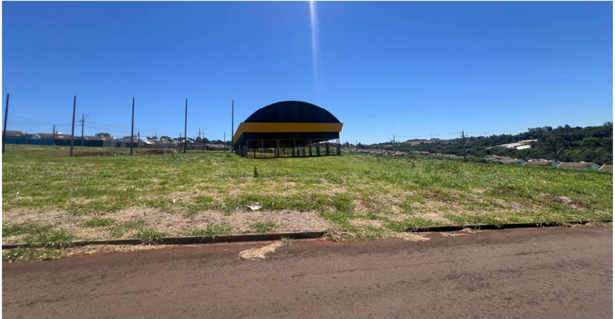
Fotografia da frente do terreno (Rua Ana Teixeira de Andrade).