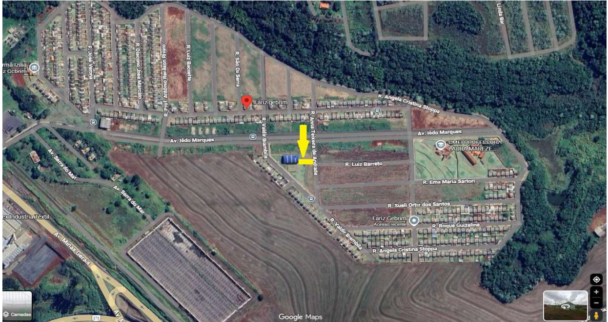
Imagem aérea do imóvel.

Local da diligência: Lote de terras sob n.º 02 da quadra n.º 22, RESIDENCIAL FARIZ GEBRIM, em Apucarana/PR