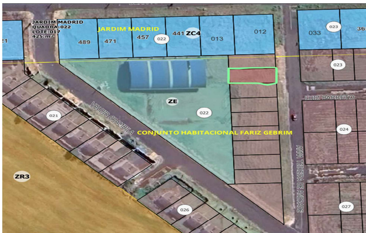
Mapa de Lotes de Apucarana/PR.

Local da diligência: Lote de terras sob n.º 02 da quadra n.º 22, RESIDENCIAL FARIZ GEBRIM, em Apucarana/PR