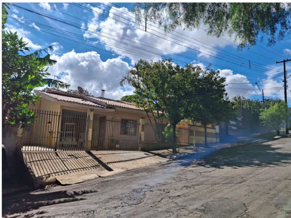
Figura 1: Frente do imóvel