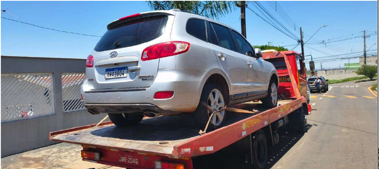
motorola edge 60 fusion

24mm f/1.8 1/1271s ISO100 23 de out. de 2025