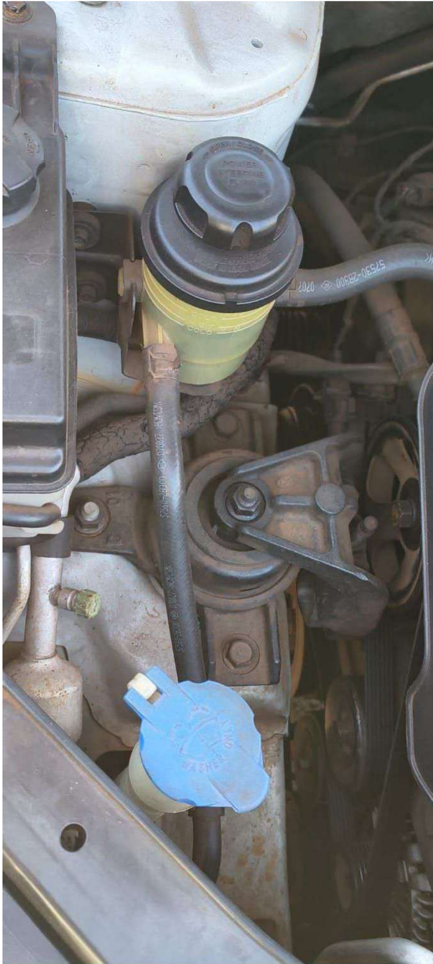
motorola edge 60 fusion

Documento assinado digitalmente, conforme MP nº 2.200-2/2001, Lei nº 11.419/2006, resolução do Projudi, do T.JPR/OE Validação deste em https://projudi.tjpr.jus.br/projudi/ - Identificador: P-JSLC UDB6X EEH7D 9YYMA