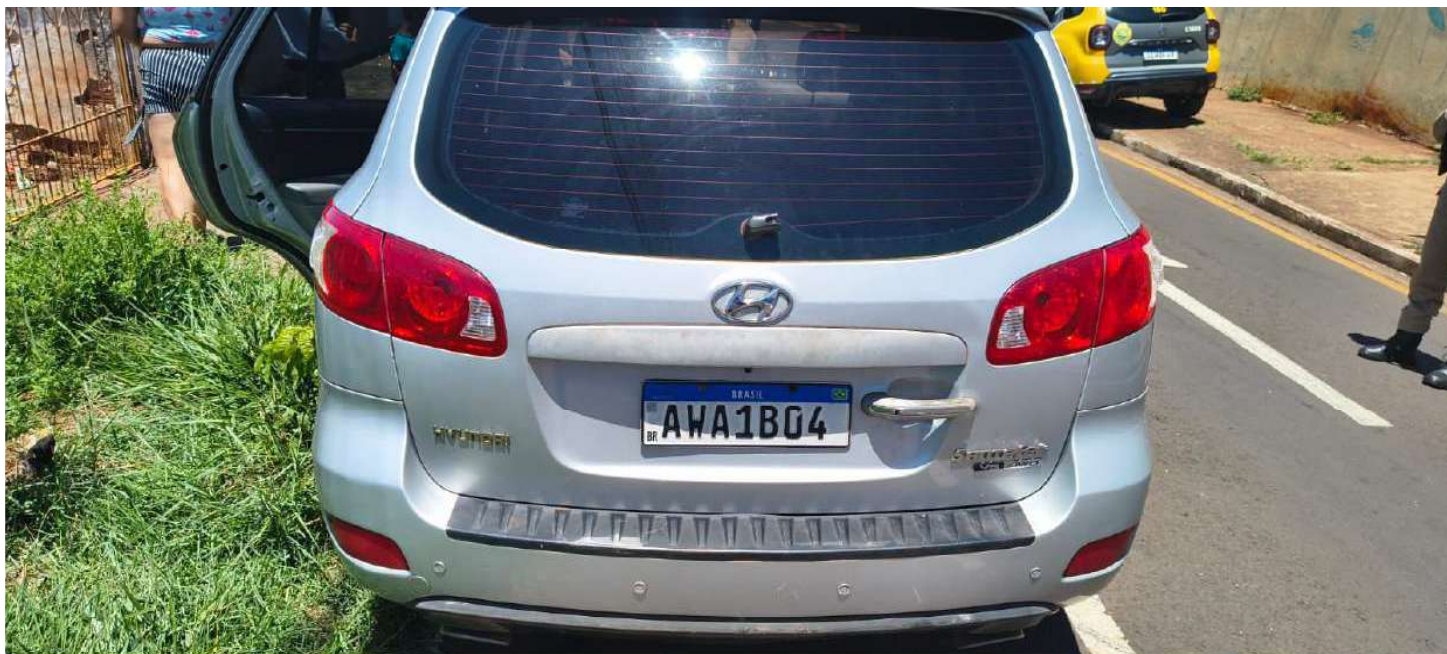
motorola edge 60 fusion

24mm f/1.8 1/2041s ISO100 23 de out. de 2025