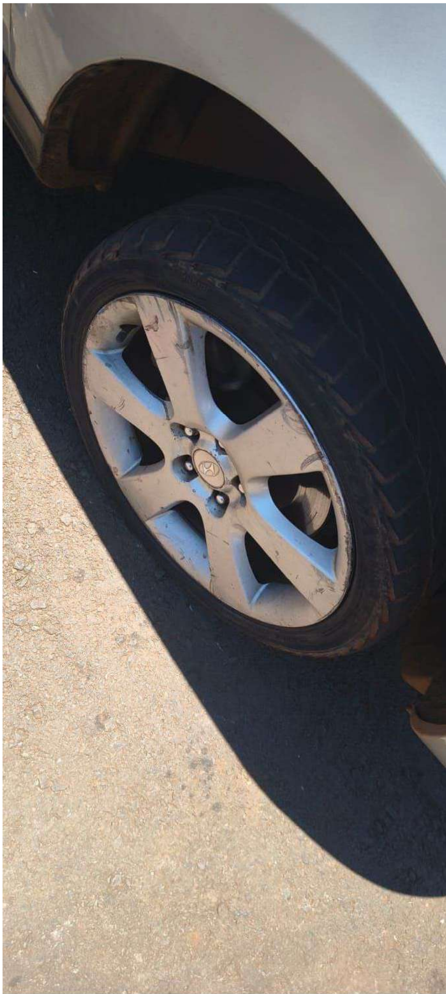
motorola edge 60 fusion

24mm f/1.8 1/549s ISO100 23 de out. de 2025