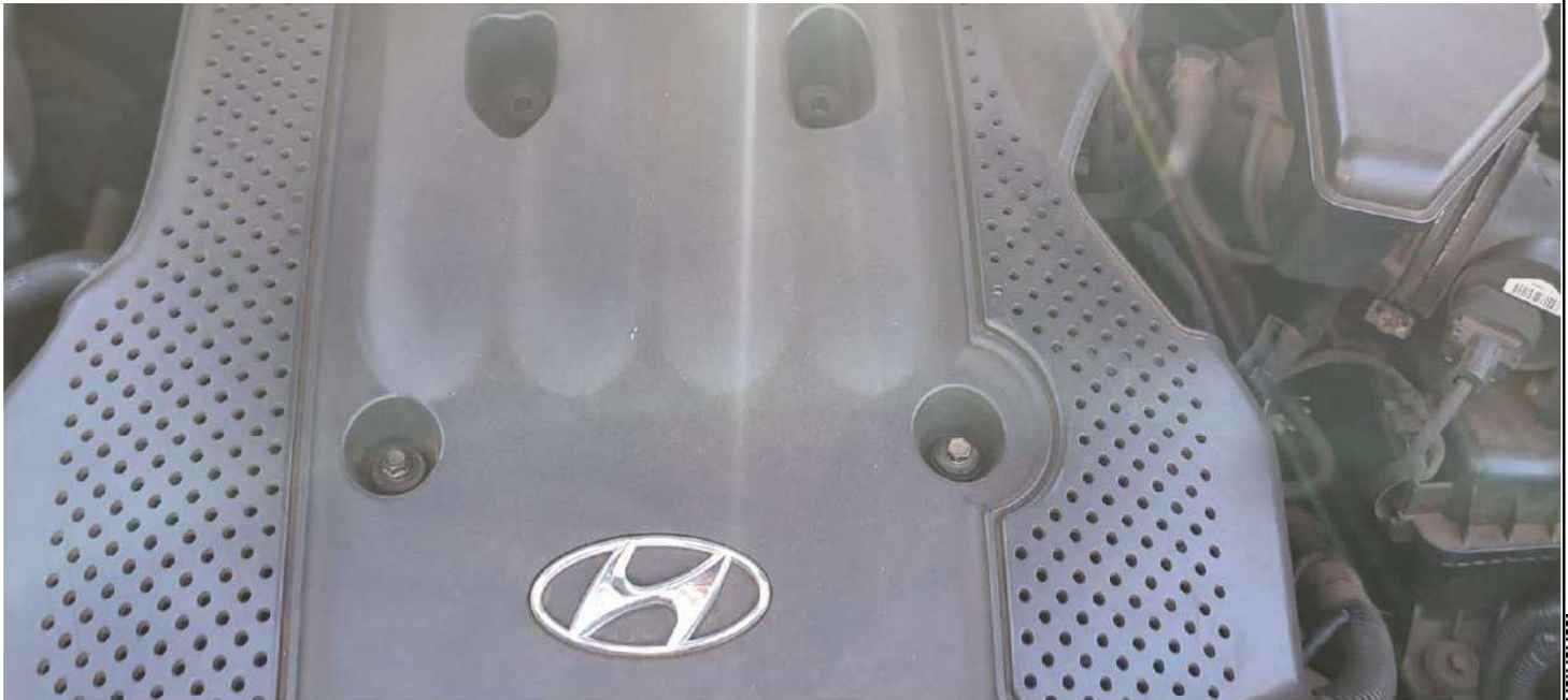
motorola edge 60 fusion

35mm f/1.8 1/100s ISO220 23 de out. de 2025