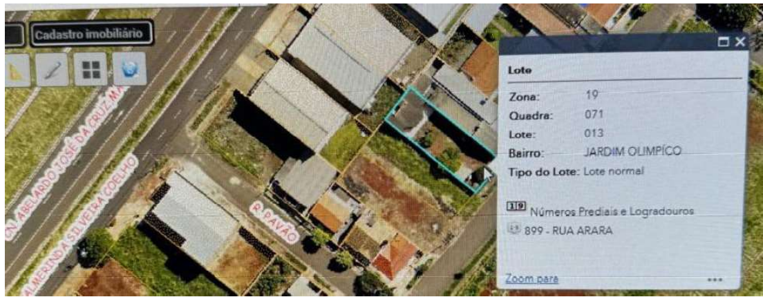
Imóvel com número predial 899, localizado ao lado