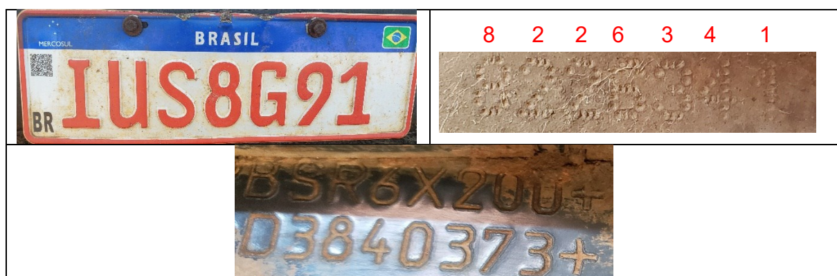
Figura 2 – Imagens da placa dianteira, da numeração do motor e da numeração do chassi do caminhão Scania R440

Na sequência, foi verificada a gravação do número VIS ( Vehicle Identification Section ) em seus vidros, não sendo constatado indícios visíveis de adulteração.