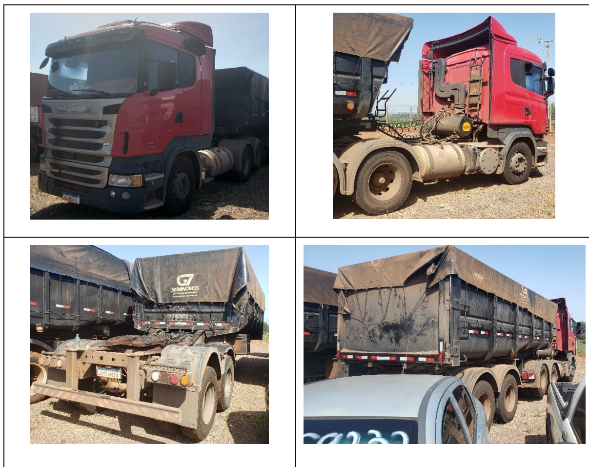
Figura 1 – Imagens dos veículos questionados. Acima, caminhão Scania R440 e abaixo, semirreboques Salvaro SBCD (imagem à esquerda) e Salvaro SBCT (imagem à direita).

O presente Laudo de Perícia Criminal Federal apresenta o resultado dos exames efetuados em 01 (um) caminhão marca Scania, modelo R440 A 6X2, de placas IUS8G91 Mercosul/Brasil, e em 02 (dois) semirreboques marca SR, sendo um modelo Salvaro SBCD, de placa QHY4H10 Mercosul Brasil e outro modelo SR Salvaro SBCT, placa QHY4H20, apresentados na Figura 1.