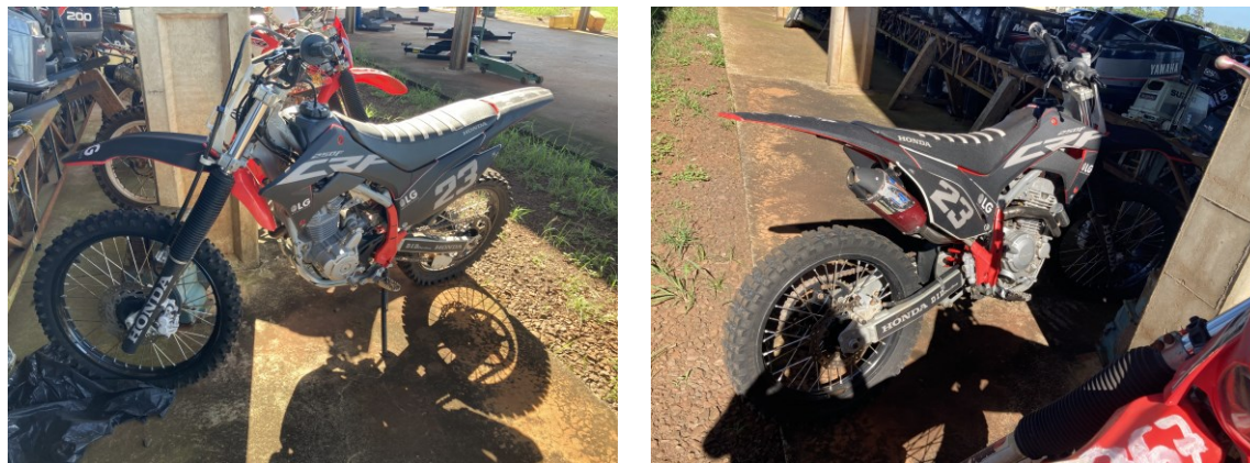
Figura 1 – Imagens da motocicleta questionada

O presente Laudo de Perícia Criminal Federal apresenta o resultado dos exames efetuados em 01 (uma) motocicleta marca Honda, modelo CRF 250R, sem placas, apresentada na Figura 1.