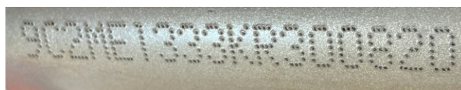
Figura 2 – Imagens da numeração do motor e da numeração do chassi.