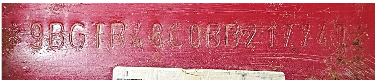
Figura 2 – Dados identificadores do veículo. Placa traseira, nº do motor e NIV (nº de Identificação Veicular) 4 .