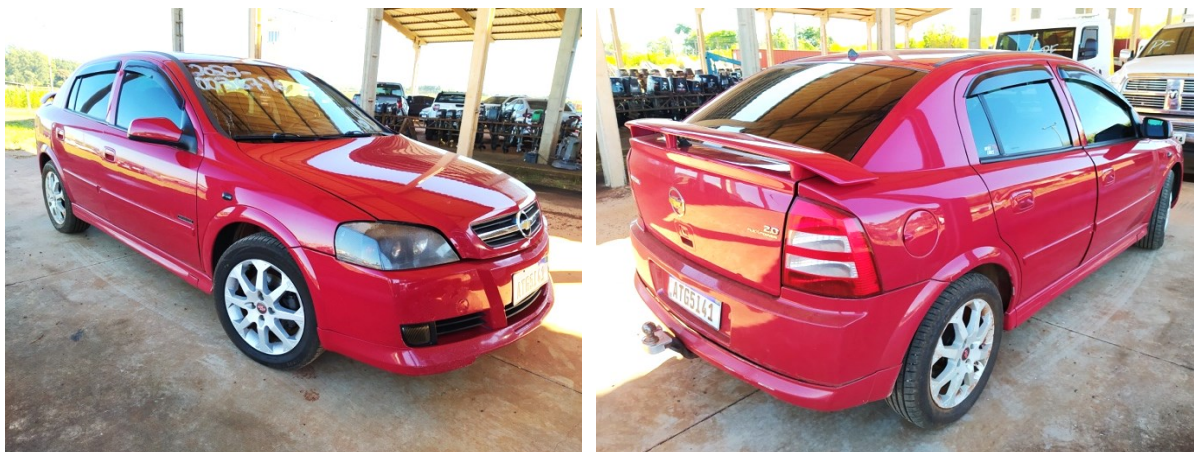
Figura 1 – Imagens do veículo questionado.

O presente Laudo de Perícia Criminal Federal apresenta o resultado dos exames efetuados em um automóvel da marca GM/CHEVROLET, modelo ASTRA HB 4P ADVANTAGE, placas ATG5I41 (modelo Mercosul), apresentado na Figura 1. O veículo corresponde ao item 6 do Termo de Apreensão nº 1855656/2023-DPF/GRA/PR.