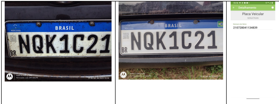
Figura 4: Placas dianteira e traseira (verdadeiras), e identificação QR Code.

O veículo não apresenta adaptações de suas características originais.