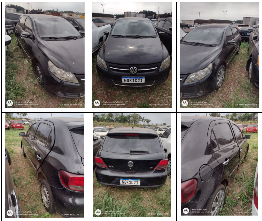
Figura 5: Fotos da frente, traseira e laterais, direita e esquerda

O veículo não apresenta adaptações de suas características originais.