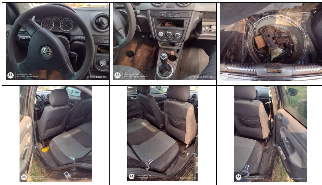
Figura 6: Fotos da parte interna

Na cabine do veículo foi não encontrado rádio comunicador.