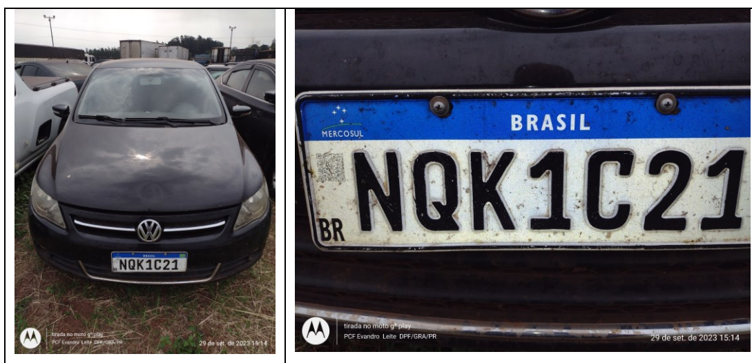
Figura 1: Veículo questionado