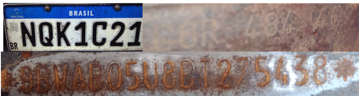
Figura 2 – Dados Identificadores do veículo. Imagens da placa dianteira, nº motor e nº chassi (verdadeiros).

Após observação dos elementos de interesse pericial, consignam-se, na Tabela 1 e nas Figuras 2 a 6, aqueles que podem fornecer um quadro geral da situação em que se encontrava o veículo examinado.