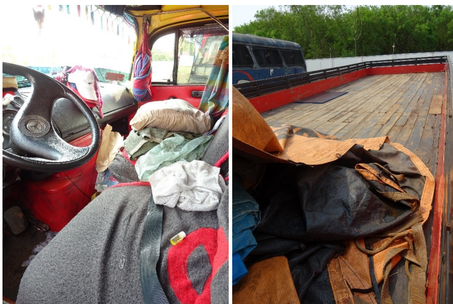
Figura 6 - Interior do veículo e carroceria.