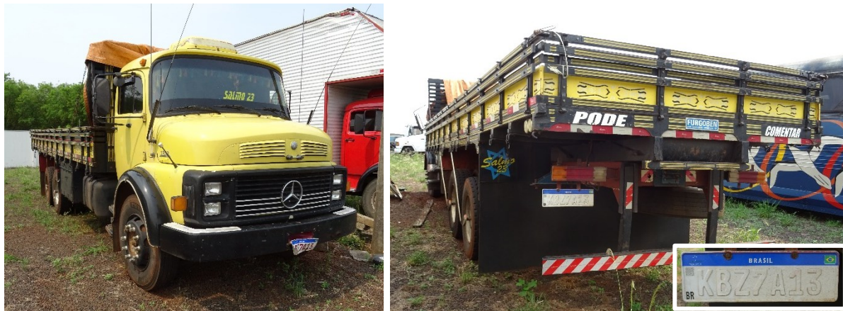
Figura 1 - Veículo examinado.

Neste Laudo serão descritos os exames realizados no veículo marca/modelo Mercedes Benz/L1113 de placa KBZ7A13 (BRASIL) .