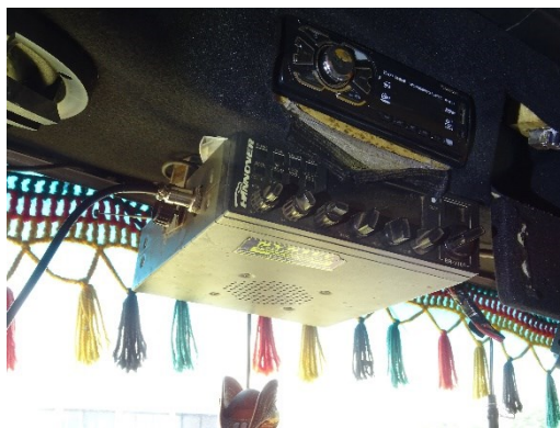
Figura 5 - Rádio para operação na Faixa Cidadão.