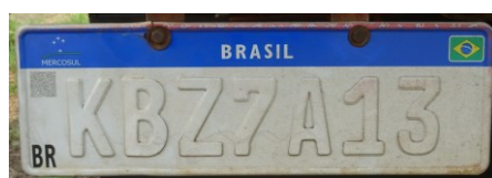
Figura 2 - Placa traseira do veículo.