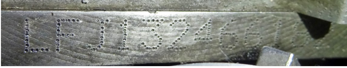
Figura 4 - Numeração do motor com sinais de adulteração.