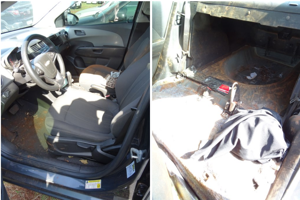
Figura 5 - Interior do veículo.