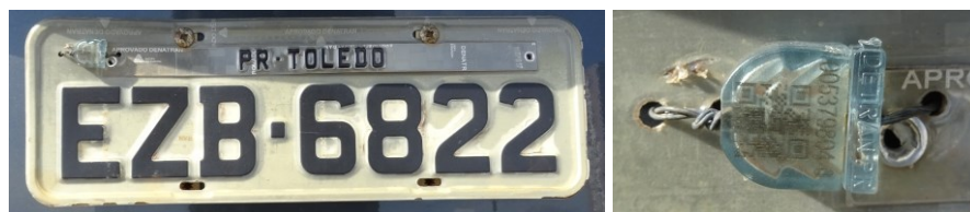
Figura 2 - Placa traseira do veículo e detalhe do lacre rompido.