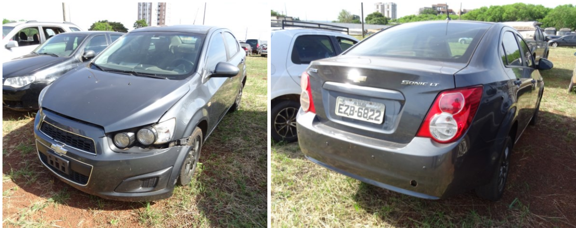
Figura 1 - Veículo examinado.

Neste Laudo serão descritos os exames realizados no veículo marca/modelo GM/Sonic LT NB AT de placa EZB-6822 (São Paulo) , mostrado a seguir: