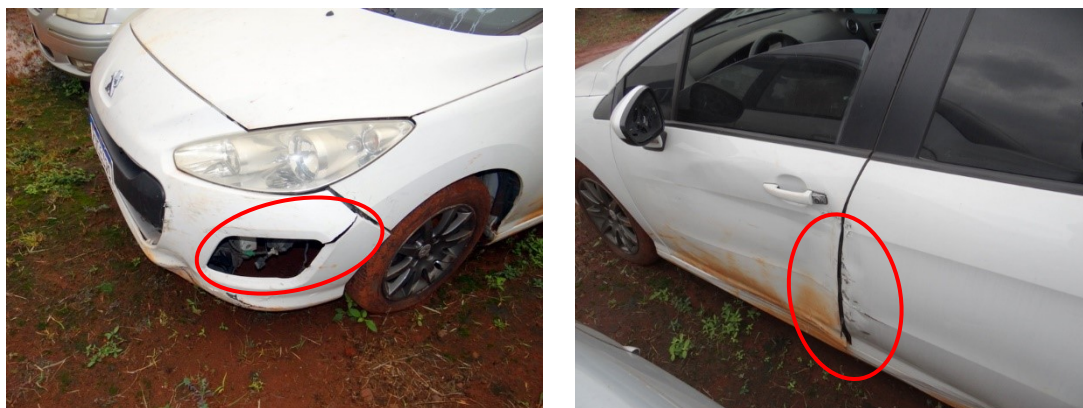
Fotografias 13 e 14 – Avarias externas do veículo, destaques em vermelho.

As Fotografias 13 e 14 ilustram as avarias observadas no veículo.