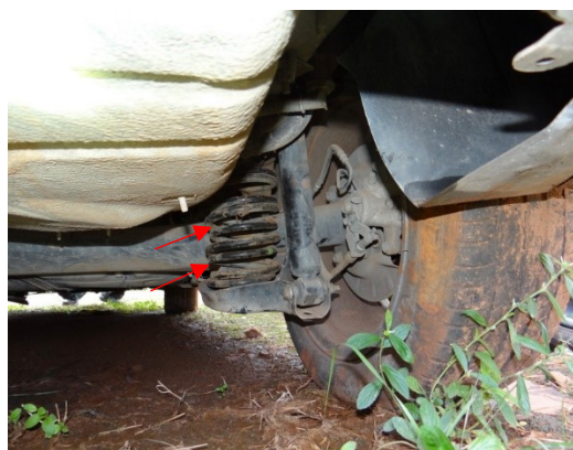
Fotografias 11 e 12 –Molas duplas traseiras do veículo, destacadas nas setas em vermelho.