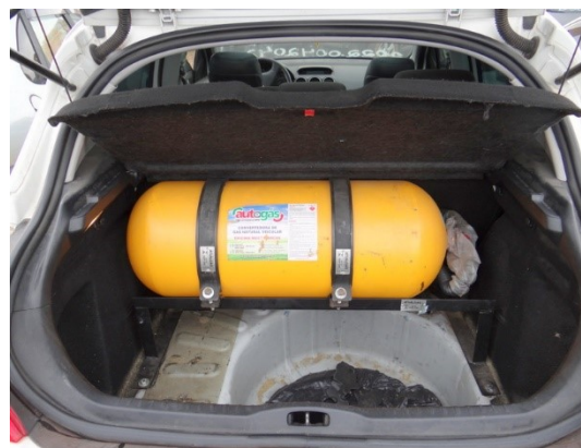
Fotografias 7 a 10 – Interior do veículo submetido a exame.

As Fotografias 11 e 12 ilustram as molas duplas da suspensão traseira, que permitem disfarçar, visualmente, um eventual excesso de carga contido no interior do veículo.