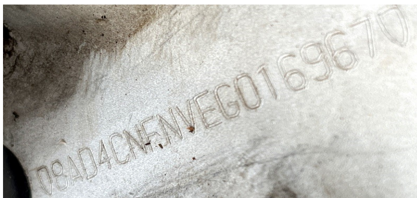
Fotografia 5 – Numeração identificadora do chassi (8AD4CNFNVEG016967).

As Fotografias 5 e 6, dispostas a seguir, ilustram as numerações do chassi (NIV) e do motor do veículo.