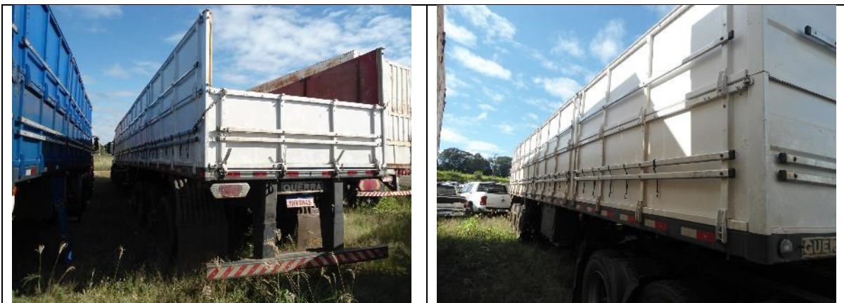
Figura 12: Vistas externas.

16. No local dos exames também foi encontrado um semirreboque da marca GUERRA, modelo SR/GUERRA AG GR, branco, com placa MHV8H45, Figuras 12 e 13.