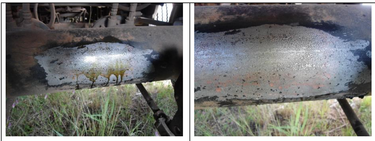
Figura 17: Tentativa de revelação da numeração do eixo traseiro.