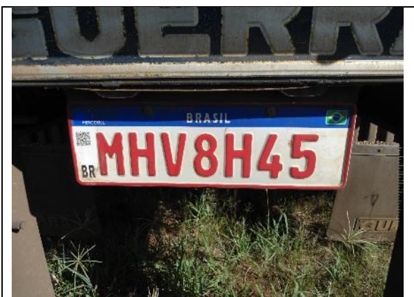
Figura 13: Placa.

17. A consulta ao QR-CODE da placa produziu o número de série 220816059737878, original.