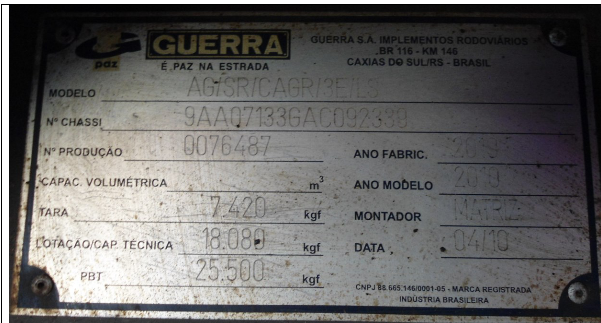
Figura 14: Plaqueta.