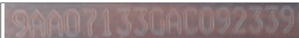
Figura 15: NIV gravado na longarina esquerda.