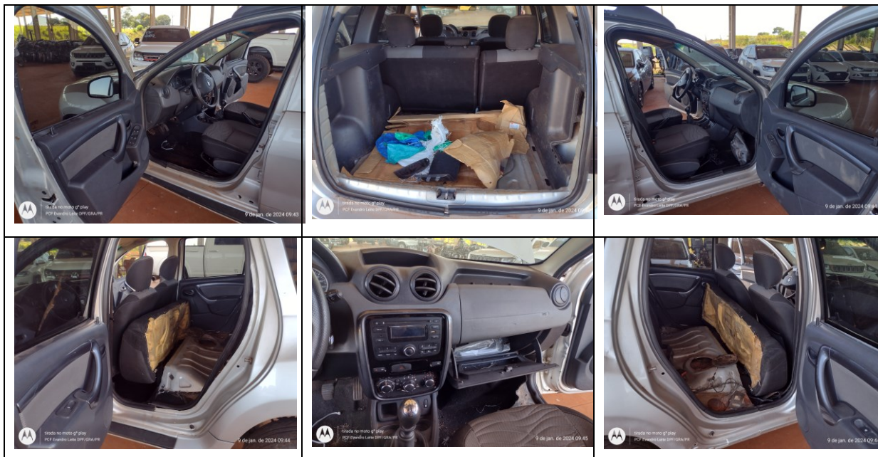
Figura 7: Imagens da frente, traseira e laterais, direita e esquerda, e interior do veículo

Não foi encontrado radiocomunicador no veículo.