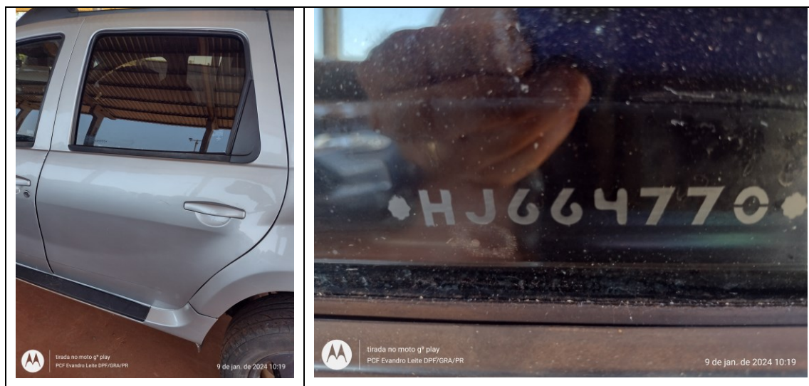
Figura 5: VIS da porta traseira direita (passageiro)

Não foram encontrados quaisquer registros de VIS nos vidros da frente (parabrisa) e traseiro.