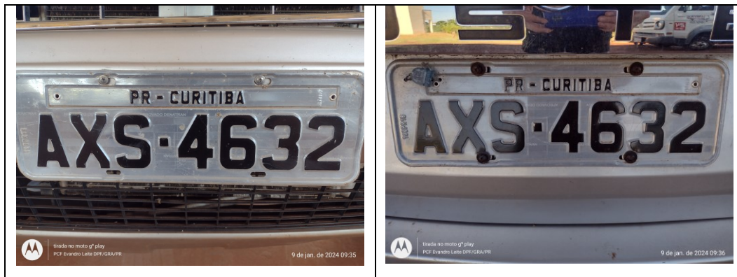
Figura 6: Placas dianteira e traseira (verdadeiras)

O veículo, nas partes externa e cabine, não apresenta alterações de suas características originais: