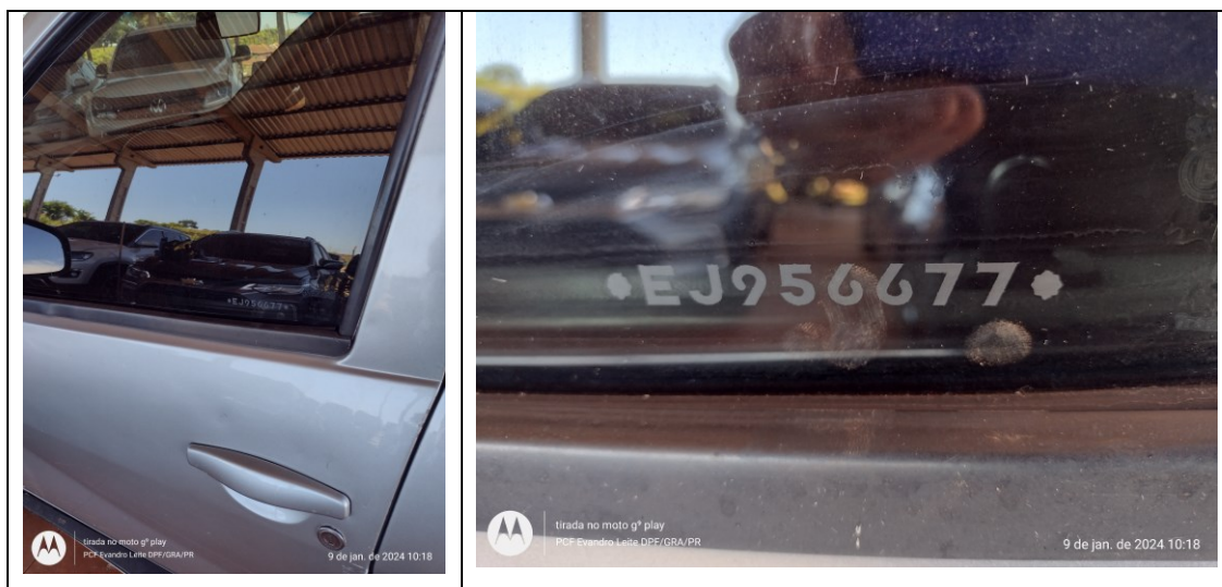
Figura 4: VIS da porta dianteira direita (motorista)

Nos vidros das portas laterais do lado direito foram localizados registros de VIS estranhos ao registro do veículo periciado.