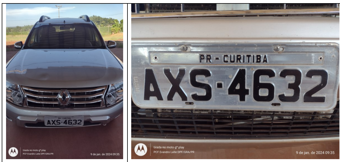
Figura 1: Veículo questionado