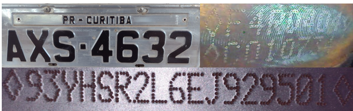
Figura 2 – Dados Identificadores do veículo. Imagens da placa dianteira, nº motor e chassi (verdadeiros)

Após observação dos elementos de interesse pericial, consignam-se, na Tabela 1 e nas Figuras 2 a 7, aqueles que podem fornecer um quadro geral da situação em que se encontrava o veículo examinado.