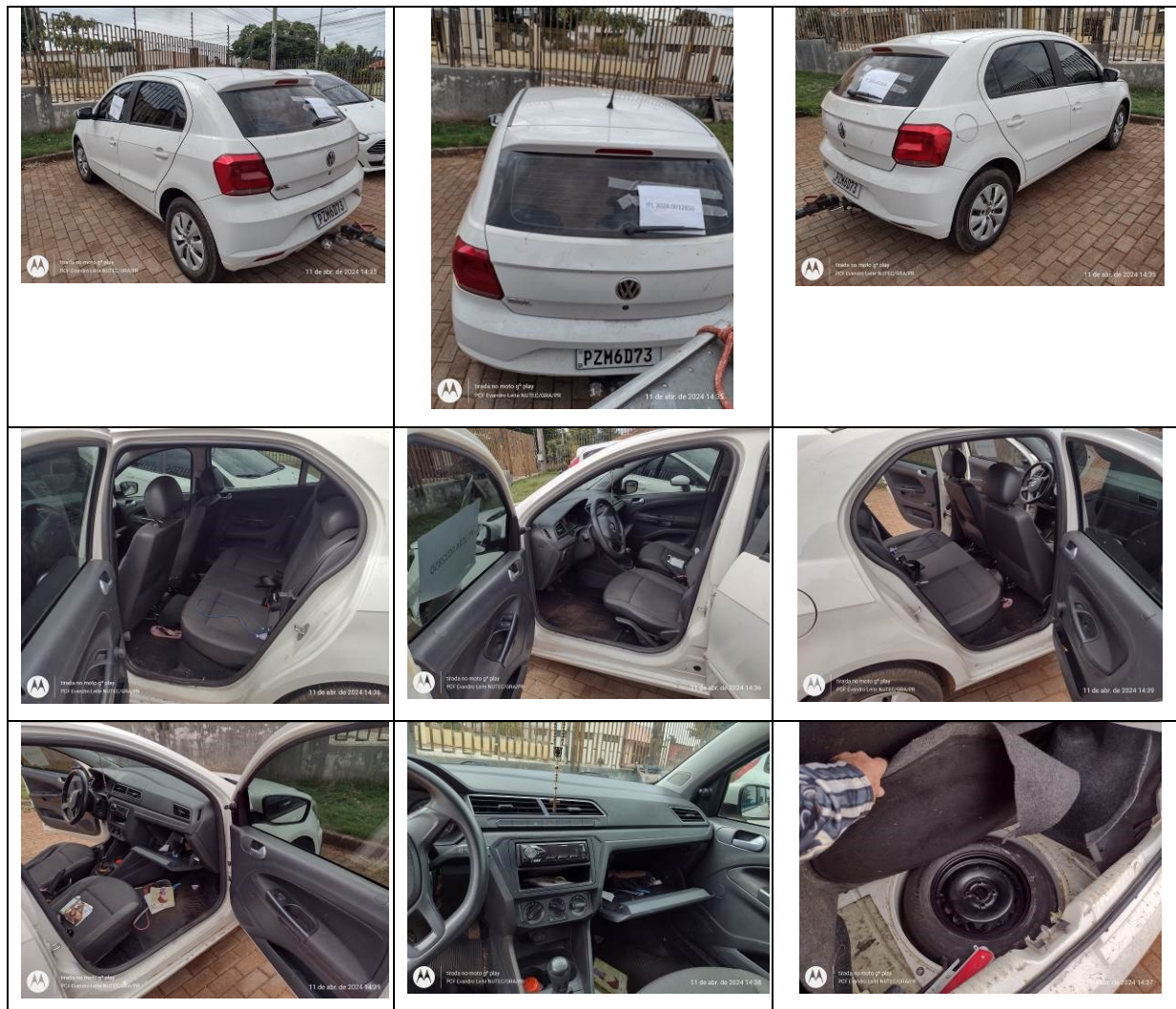
Figura 6: Fotos frente, traseira e laterais, direita e esquerda, e interior do veículo

Não foi encontrado radiocomunicador no veículo.