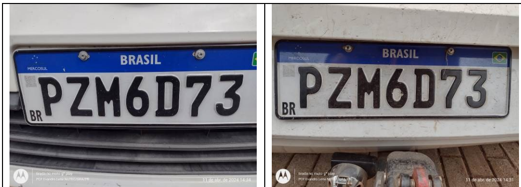
Figura 4 – Placas dianteira e traseira.