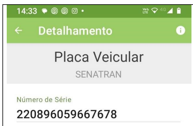
Figura 5 – Série do QRCode placa dianteira.

O veículo, nas partes externa e cabine, não apresenta alterações de suas características originais: