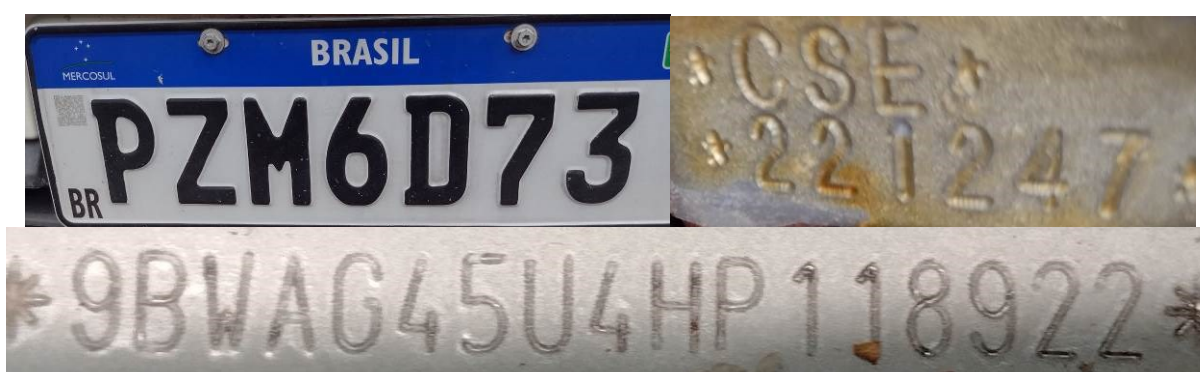
Figura 2 – Dados Identificadores do veículo.

Após observação dos elementos de interesse pericial, consignam-se, na Tabela 1 e nas Figuras 2 a 6, aqueles que podem fornecer um quadro geral da situação em que se encontrava o veículo examinado.