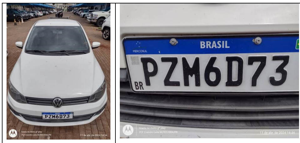
Figura 1: Veículo questionado