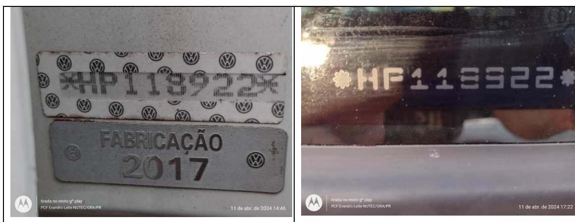
Figura 3: Registros do VIS

Correspondentes número VIS ( Vehicle Identification Section ) 4 do veículo examinado – HP118922 – foram localizados em etiquetas e em diversos vidros.