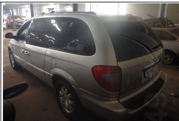
Figura 2 – Região posterior esquerda.