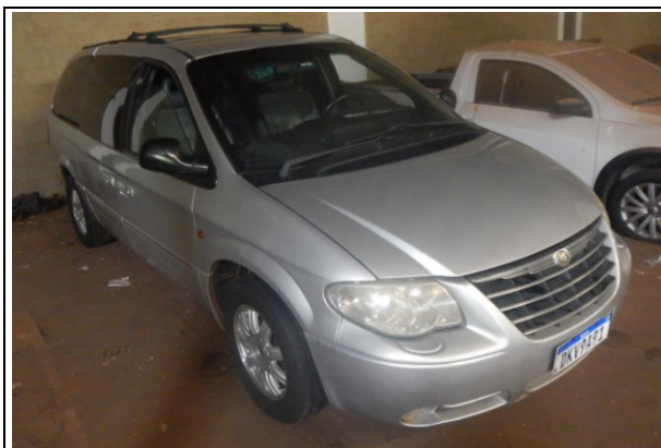
Figura 1 – Região anterior direita.

Mostrado nas Figuras 1 e 2, trata-se de um veículo camioneta, marca CHRYSLER, modelo GRAND CARAVAN LIMITED, cor prata, ano de fabricação/modelo 2004/2005, placa DKV9A91.