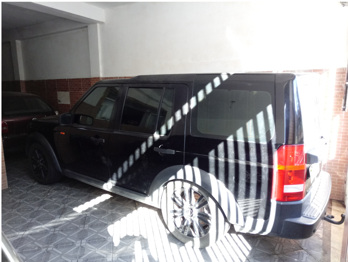
Fotografia 5 - Vista lateral do veículo