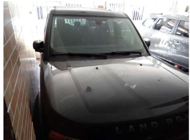
Fotografias 1 e 2 - Vista frontal do veículo