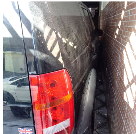
Fotografias 3 e 4 - Vista traseira do veículo