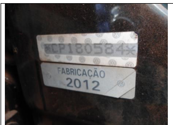
Fotografia 12: Etiquetas com VIS e ano de fabricação.