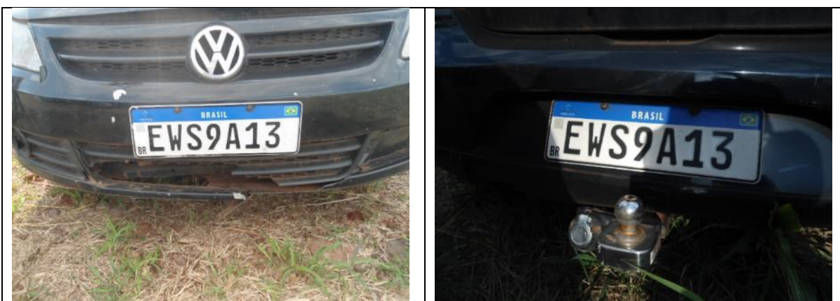
Fotografias 3 e 4: Placas dianteira e traseira.