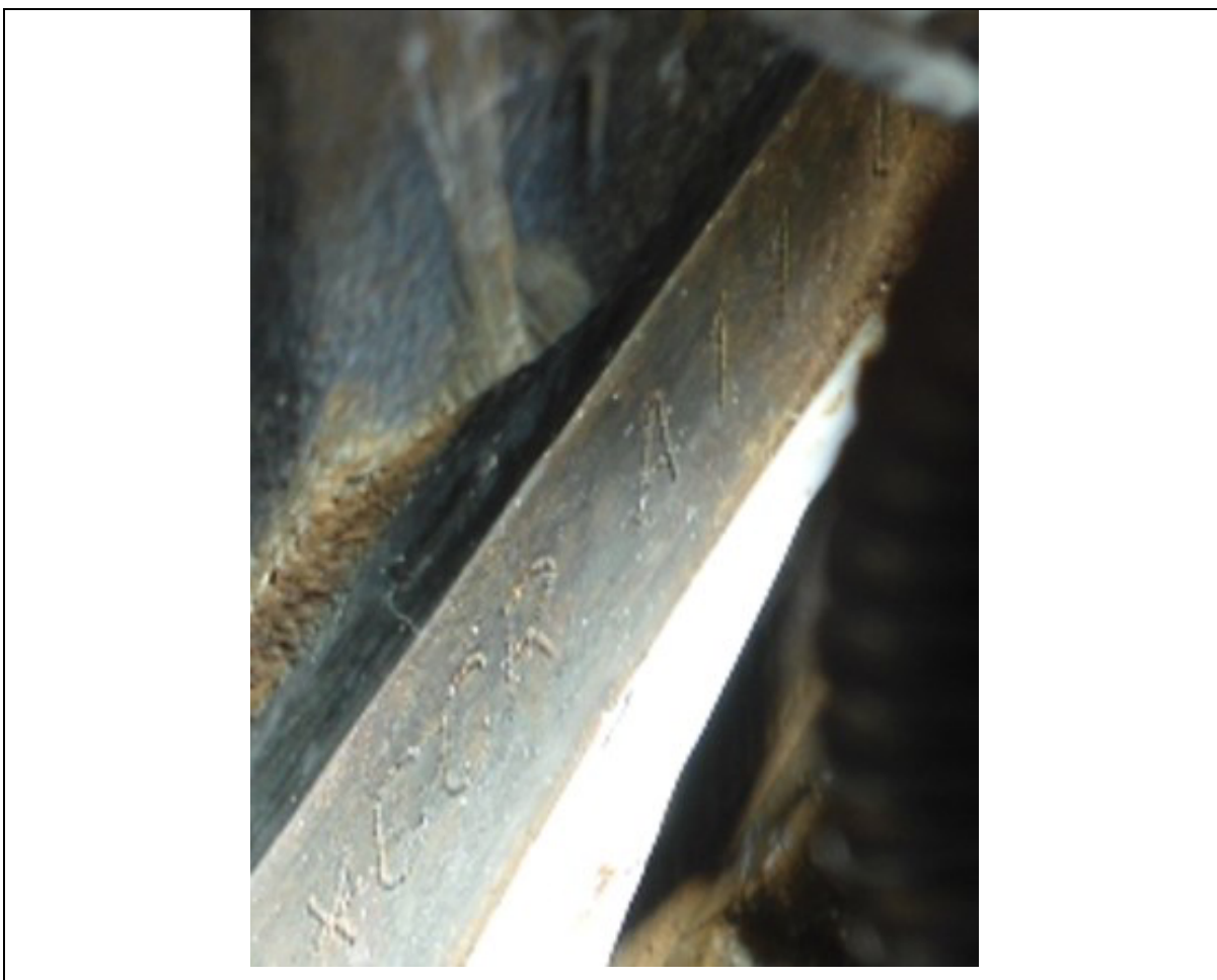
Fotografia 13: Visão parcial da numeração do motor.

19. Em consulta ao site da Fundação Instituto de Pesquisas Econômicas ( http://www.fipe.org.br ), em 04/06/2024, foi encontrado o preço médio de R$ 29.639,00 (Código FIPE: 005276-0) para veículos semelhantes ao veículo questionado (Gol (novo) 1.6 Mi Total Flex 8V 4p).