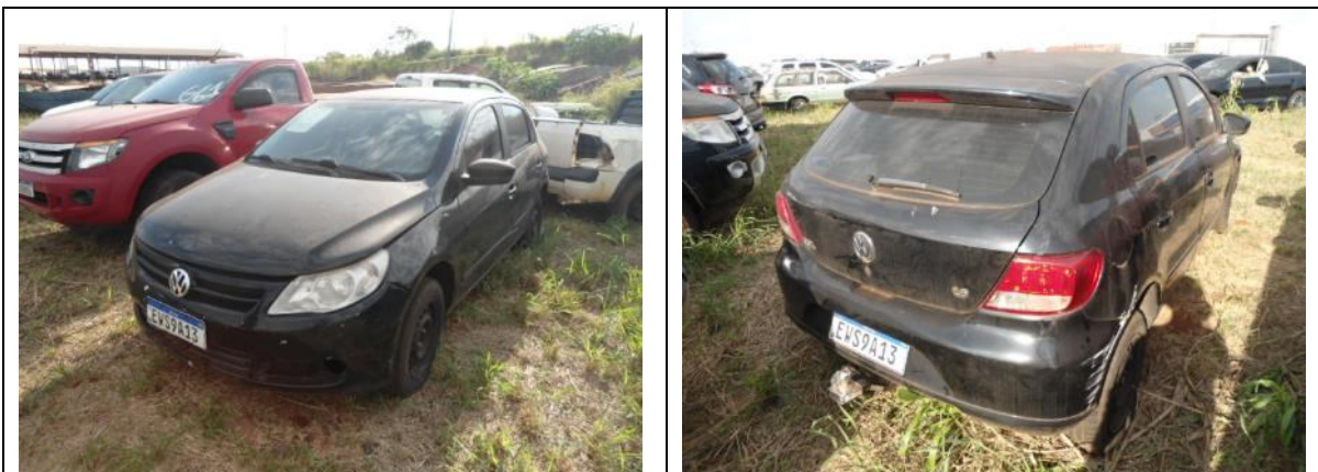
Fotografias 1 e 2: Vistas externas.