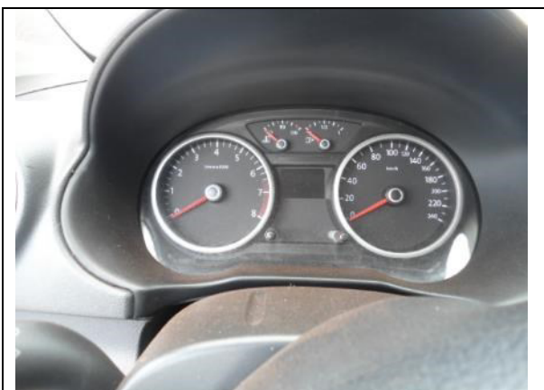
Fotografia 10: Painel.

18. Como elementos de identificação, foram encontrados: