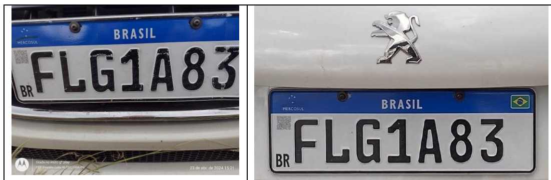
Figura 4 – Placas dianteira e traseira.

O veículo portava placas FLG1A83, dianteira e traseira, dadas como verdadeiras.