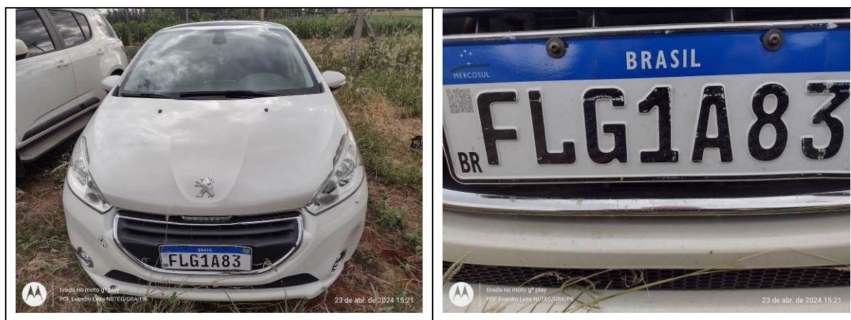
Figura 1: Veículo questionado