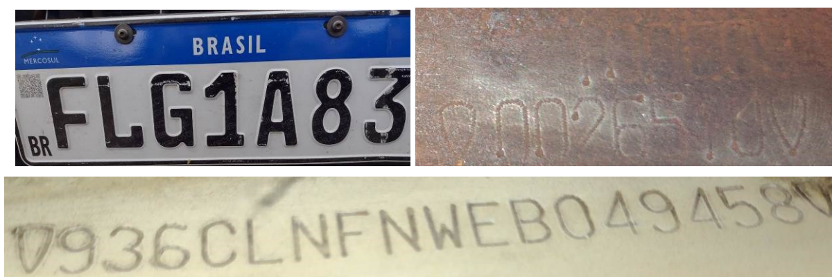
Figura 2 – Dados Identificadores do veículo. Imagens da placa dianteira, nº motor e chassi, sem sinais de adulterações.

Após observação dos elementos de interesse pericial, consignam-se, na Tabela 1 e nas Figuras 2 a 6, aqueles que podem fornecer um quadro geral da situação em que se encontrava o veículo examinado.