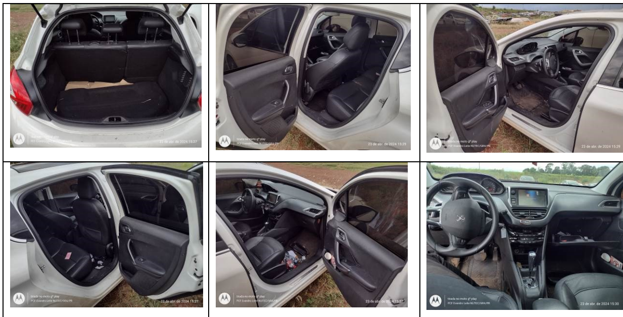
Figura 6: Fotos frente, traseira e laterais, direita e esquerda, e interior do veículo

Não foi encontrado radiocomunicador no veículo.