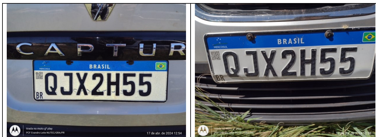
Figura 4 – Placas dianteira e traseira.

O veículo portava placas QJX2H55 , dianteira e traseira, dadas como verdadeiras. Em consulta ao sítio eletrônico da Secretaria Nacional de Trânsito - SENATRAN, foi verificado que os números de série dos QRCode estampados nas placas dianteira (200616017541683) e traseira (200616017541684) estão devidamente registrados de forma regular.