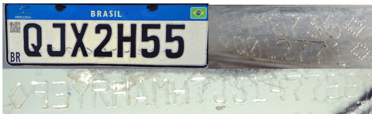
Figura 2 – Dados Identificadores do veículo. Imagens da placa dianteira, nº motor e chassi, sem sinais de adulterações.

Após observação dos elementos de interesse pericial, consignam-se, na Tabela 1 e nas Figuras 2 a 6, aqueles que podem fornecer um quadro geral da situação em que se encontrava o veículo examinado.