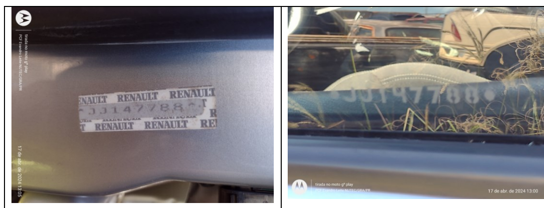
Figura 3: Registros do VIS

Correspondentes número VIS ( Vehicle Identification Section ) 4 do veículo examinado – JJ147788 – foram localizados em etiquetas e em diversos vidros.