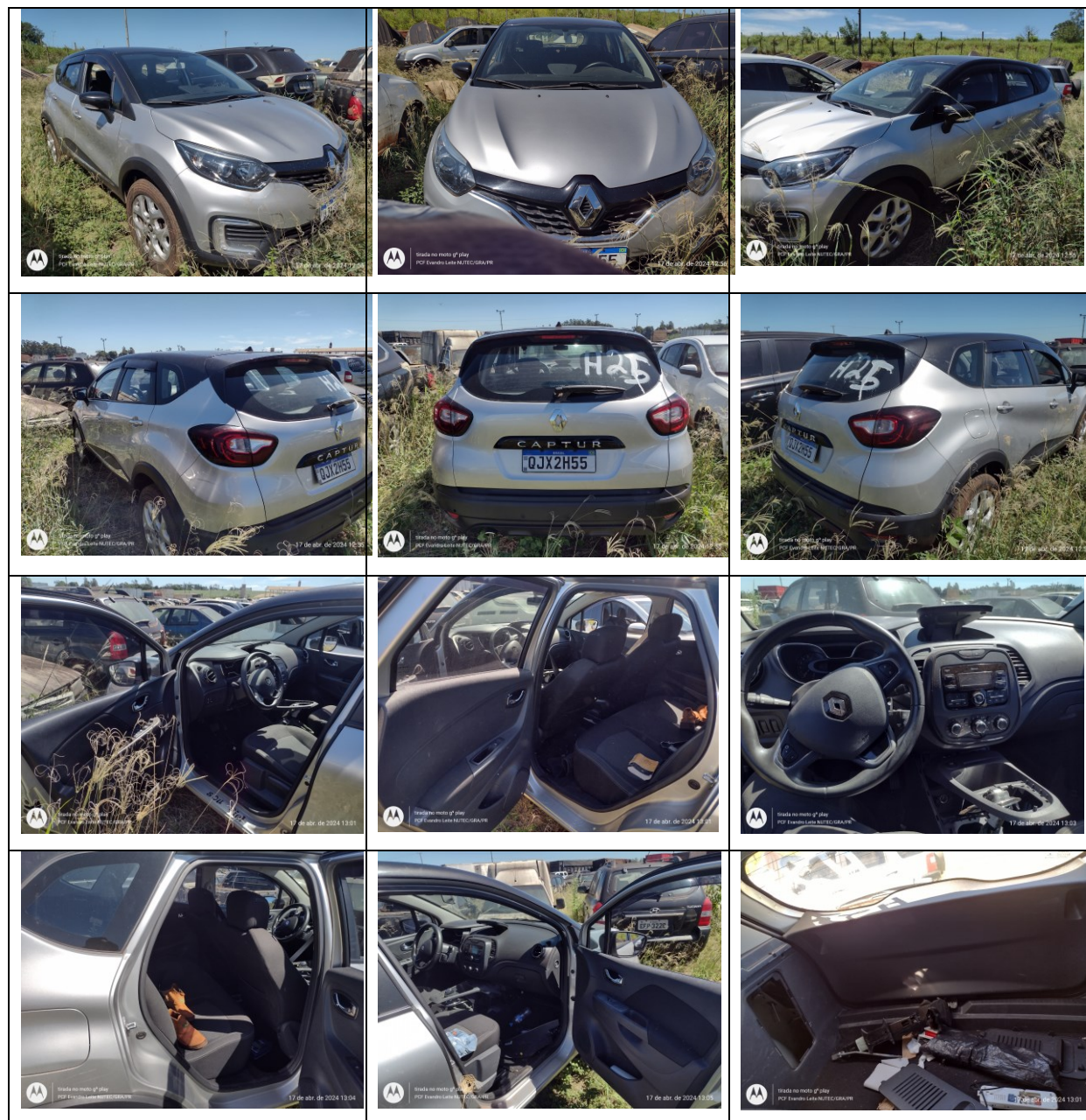
Figura 6: Fotos frente, traseira e laterais, direita e esquerda, e interior do veículo

Não foi encontrado radiocomunicador no veículo.