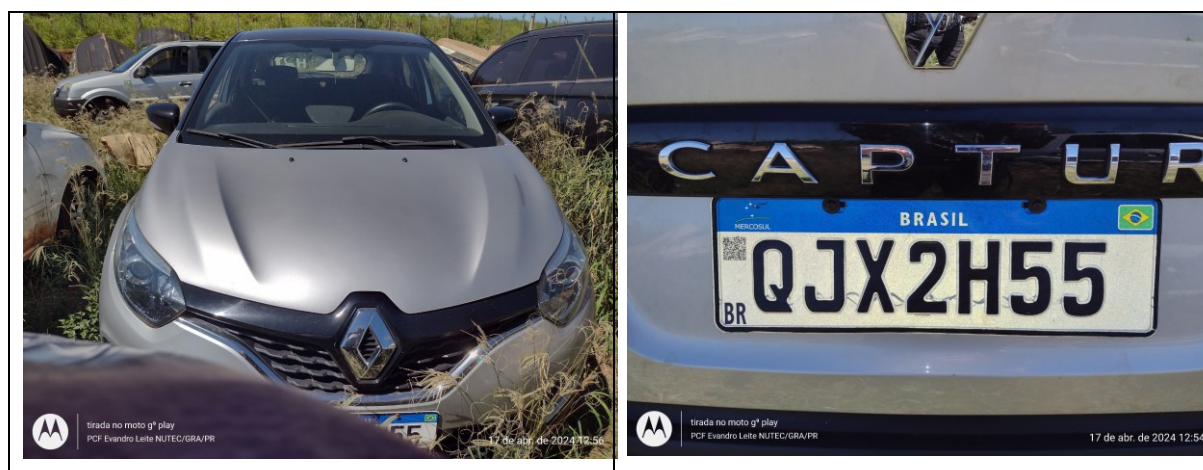
Figura 1: Veículo questionado