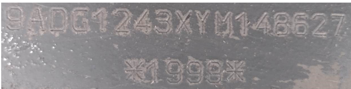
Figuras 1 a 4 – Dados Identificadores do veículo. Imagens da placa, registros do eixo final e chassi (direito e esquerdo, respectivamente), sem vestígios de adulteração.