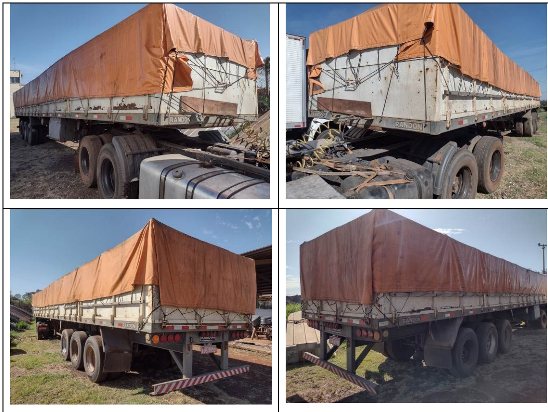
Figuras 7 a 10 – Imagens do veículo questionado.

O veículo não apresenta alterações estruturais de suas características originais.