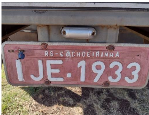
Figura 6 – Placa única.

O veículo porta placa IJE1933, unicamente na traseira, dada como verdadeira.