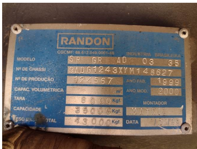
Figura 5 – Plaqueta de identificação.

Além da numeração dos chassis identificados na carroceria do veículo, idêntico número VIN ( Vehicle Identification Number ) foi também localizado em 1 (uma) plaqueta metálica.