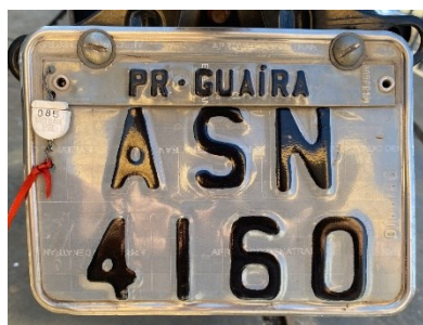
Tabela 1 - Caracterização do veículo.