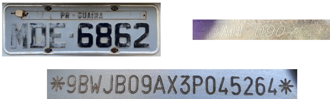
Figura 2 - Dados identificadores do veículo: placa traseira, nº do motor e nº do chassi.