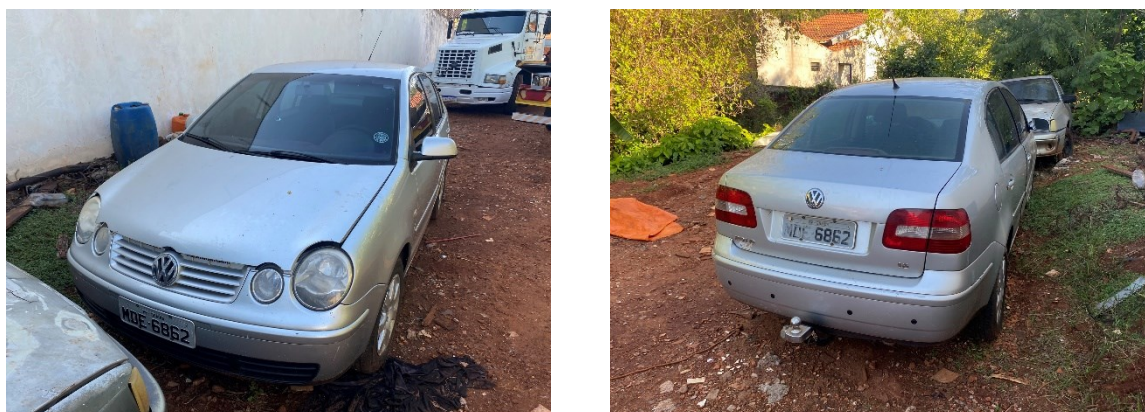
Figura 1 - Imagens do veículo questionado, que foi apresentado para exames periciais.

Conforme cópia do Termo de Apreensão (TA) nº 2571726/2024-DPF/GRA/PR (Apreensão S/N) do Procedimento mencionado no preâmbulo deste Laudo, o veículo corresponde ao item 3.