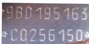
Figura 03 – Número de Identificação Veicular gravado no assoalho