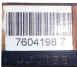
Figura 05 – Número da Carroceria