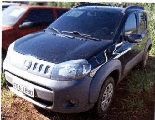
Figura 01 – Vista anterior esquerda

O veículo apresentado a exame foi um Fiat Uno Way 1.4, placas FBA-1880 (Figuras 01 e 02).