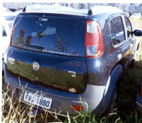
Figura 02 – Vista posterior direita