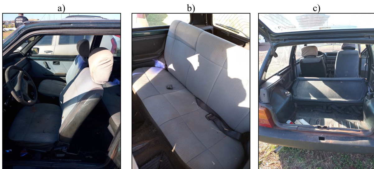
Figura 3 – Imagens adicionais do veículo examinado.

O veículo não apresenta alterações de suas características originais. Não foi encontrado radiocomunicador. Mais imagens são apresentadas na Figura 3.