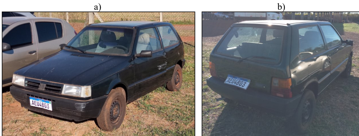
Figura 1 – Imagens do veículo examinado.

O presente Laudo Pericial apresenta o resultado do exame efetuado no veículo Fiat Uno, Placas ostentadas AEU4B03, cor verde, constante no Termo de Apreensão nº 2519452/2024. A Figura 1 ilustra o veículo examinado.